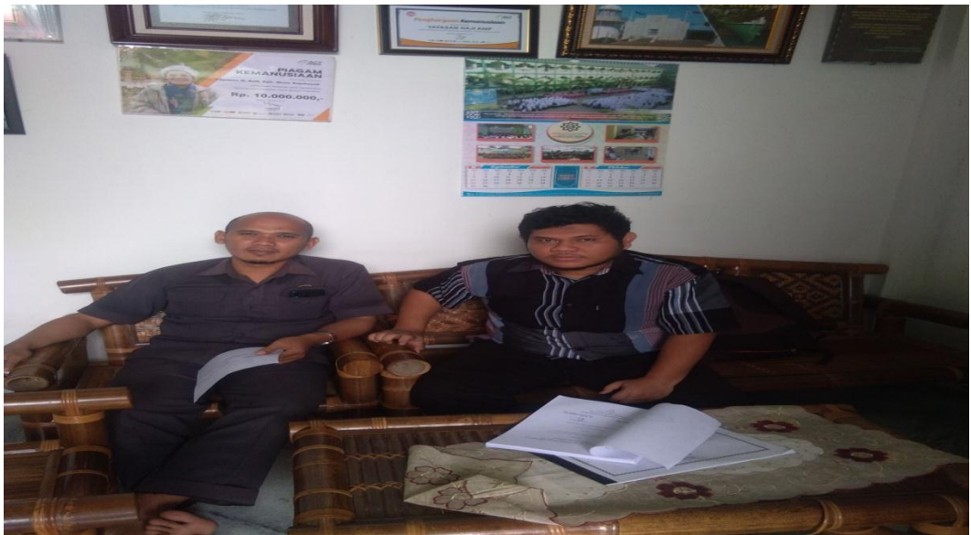
Foto Bersama Staff Umum & Koordinator Lapangan