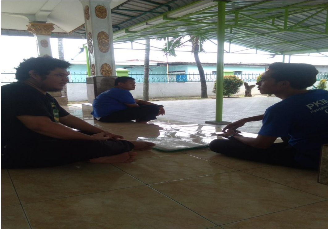
Petugas Tim 04 YHA