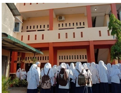
Guru membimbing siswa yang mengalami kesulitan dalam belajar