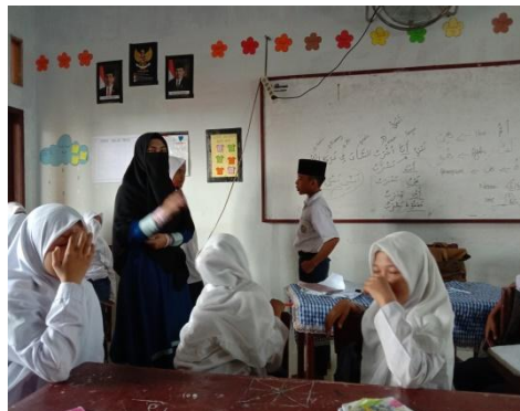
Guru menyampaikan materi dan menjelaskan langkah-langkah pembelajaran permainan tebak kata