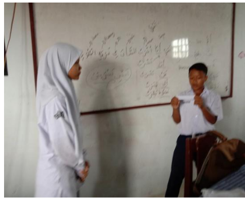
Peserta didik melakukan kegiatan tebak kata dengan pasangan/kelompok di depan kelas