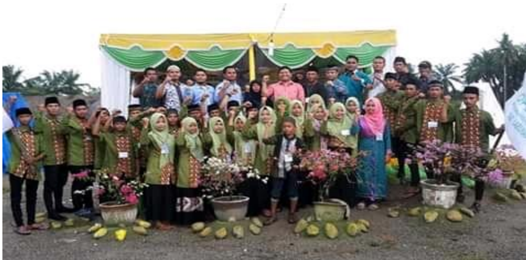
Foto Bersama Remaja Masjid Al-amin Dusun Kuala Simpang dengan Ketua DPK BKPRMI Aek Natas Pada Acara Tablig Akbar Menyambut Bulan Ramadhan Di Desa Terang Bulan.