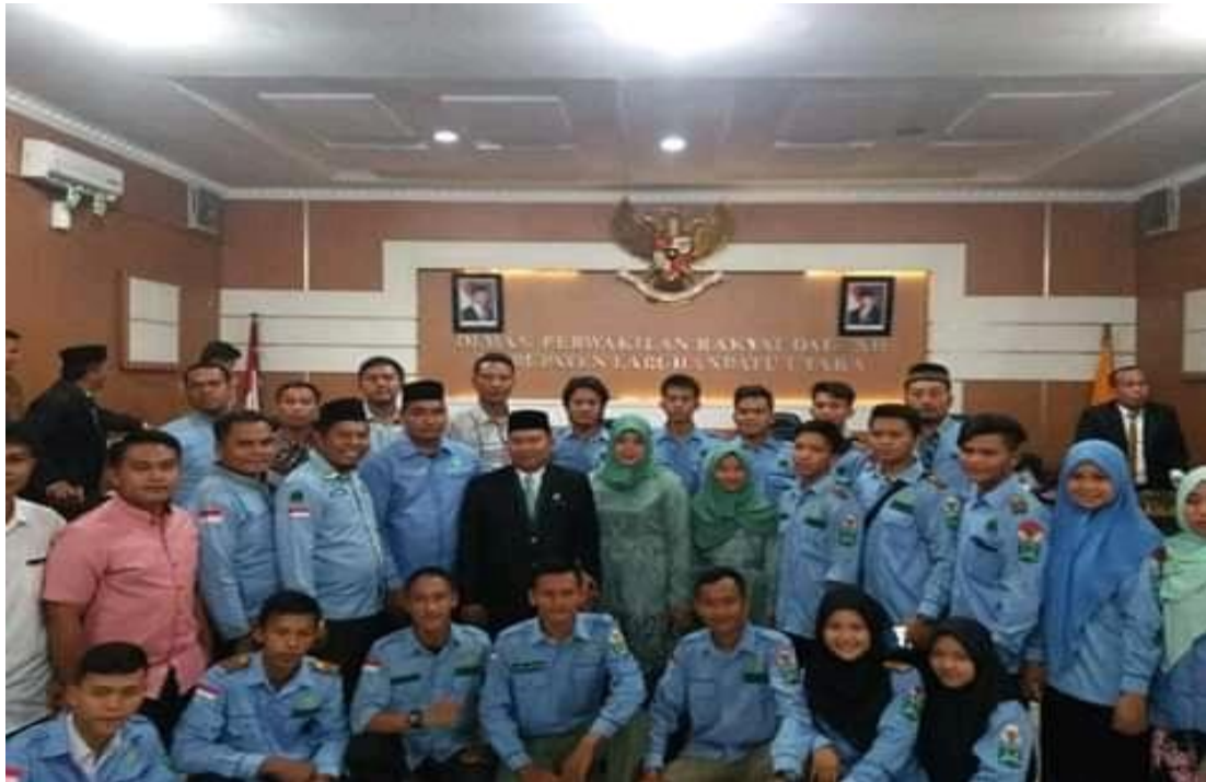
Foto Bersama Pengurus Harian DPK BKPRMI Aek Natas Dengan Salah Satu Anggota DPRD Labuhanbatu Utara.