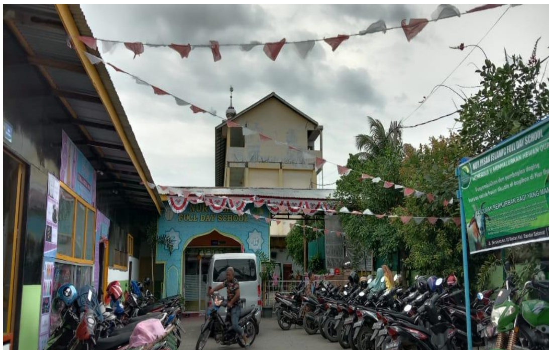
Gambar.1 Yayasan Pinta Harapan SMP Swasta Nur Ihsan Medan.