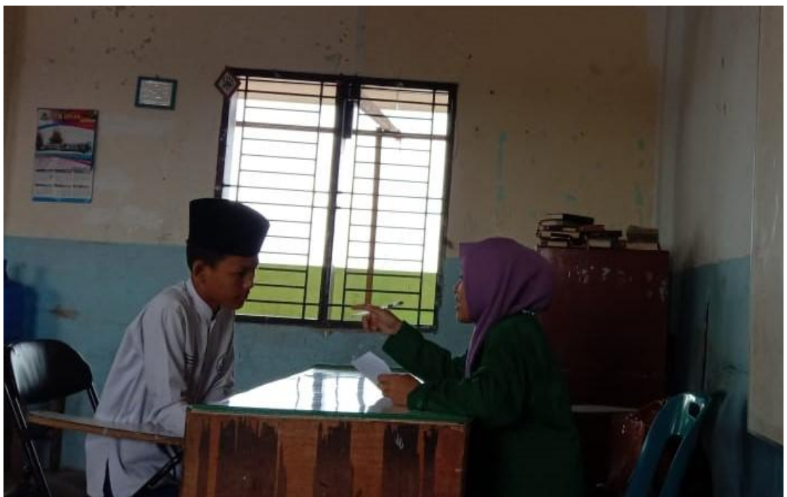
ra dengan siswa Yayasan Pinta Harapan SMP Swasta Nur Ihsan Medan, Kelas VIII-3,