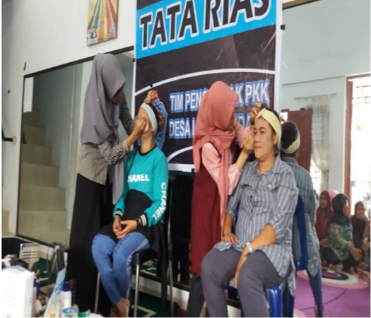
Photo Dalam Kegiatan Pelatihan Tata Rias