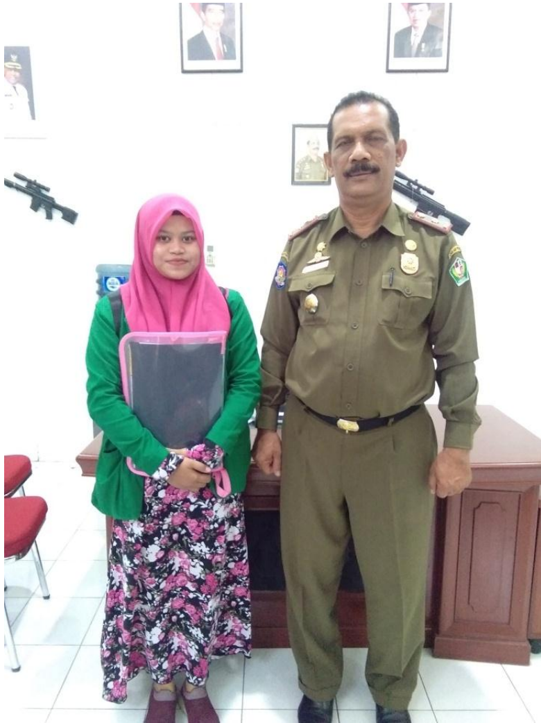
Foto bersama Kepala Satpol PP dan WH Kabupaten Pidie