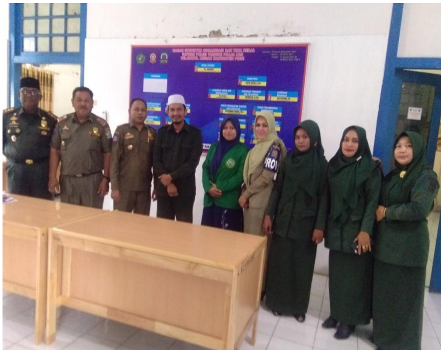
Foto bersama Staff Satpol PP dan WH Kabupaten Pidie