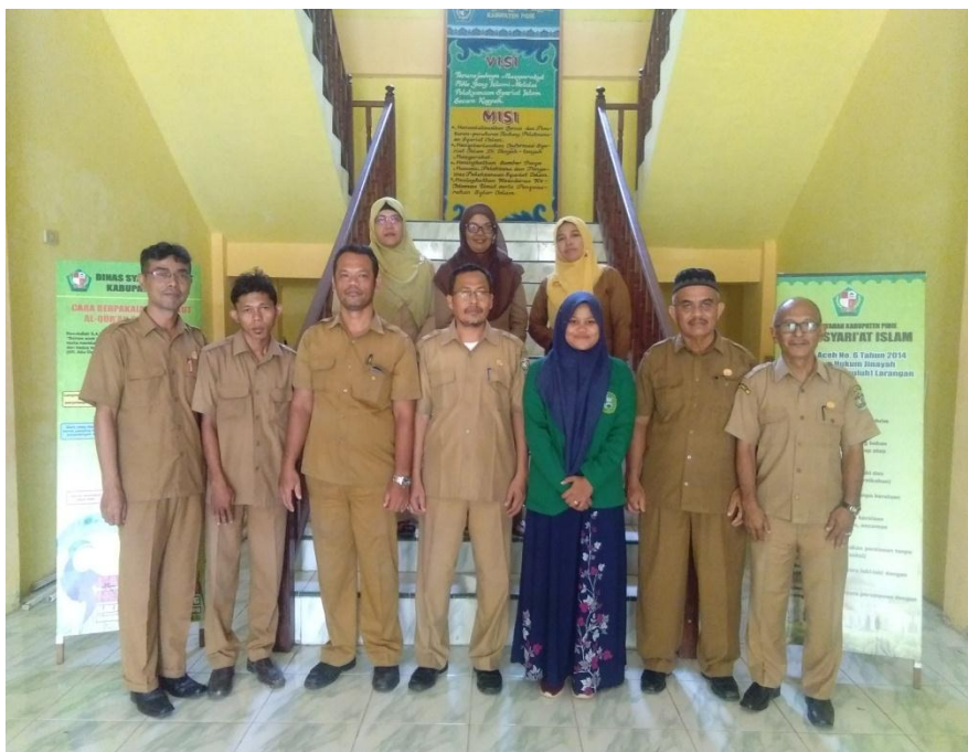
Foto bersama Staff Dinas Syariat Islam Kabupaten Pidie