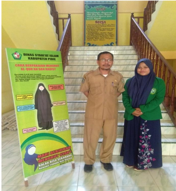
Foto bersama Sekretaris Dinas Syariat Islam Kabupaten Pidie