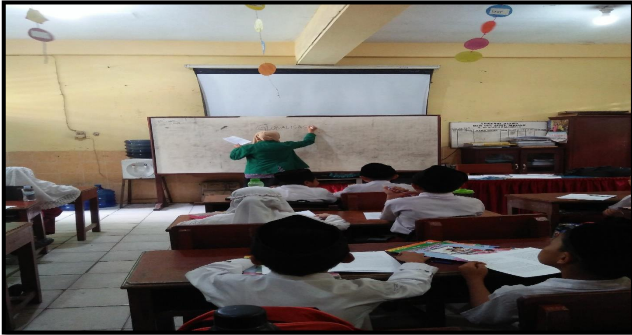
Gambar 1. Guru menyampaikan materi yang akan disajikan.