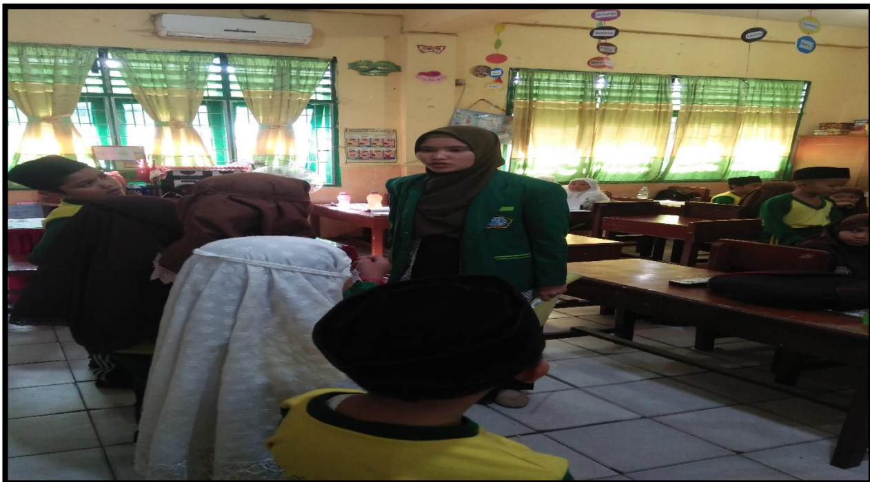
Gambar 4. Masing-masing ketua kelompok menemui guru untuk mendapatkan penjelasan materi dari guru