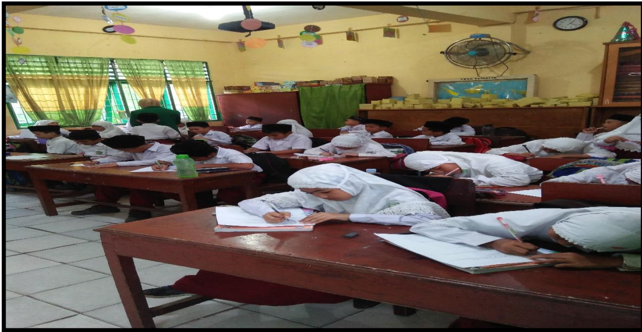
Gambar 9. Siswa mengerjakan soal post test