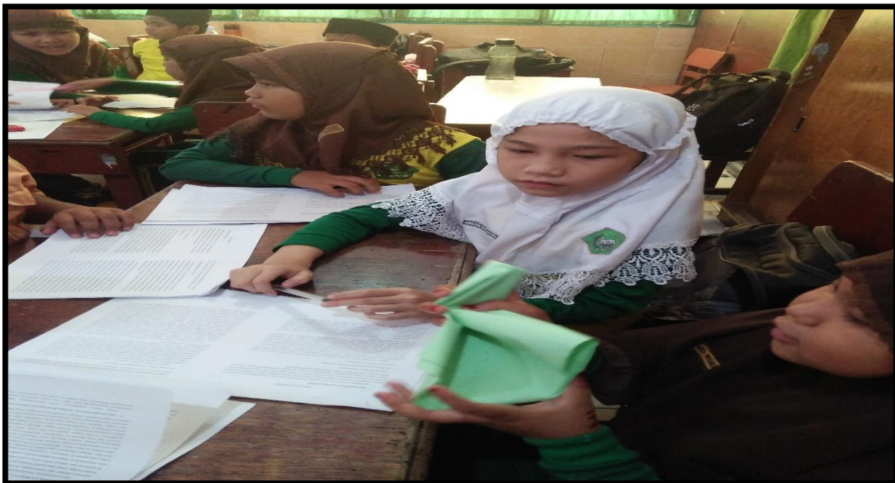
Gambar 6. Siswa membuat kertas seperti bola berisi pertanyaan dan siap diberikan ke siswa lain