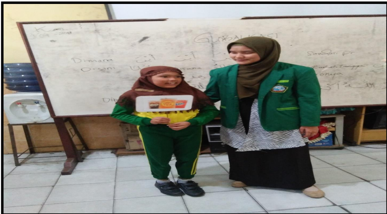
Gambar 2. Siswa menjelaskan gambar kepada temannya