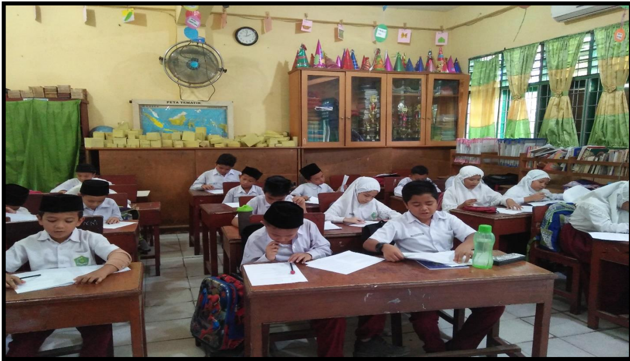
Gambar 3. Siswa mengerjakan soal pree test