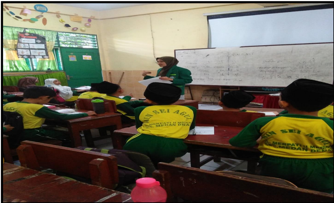
Gambar 10. Guru memberikan kesimpulan atas pelajaran yang telah diajarkan kepada siswa