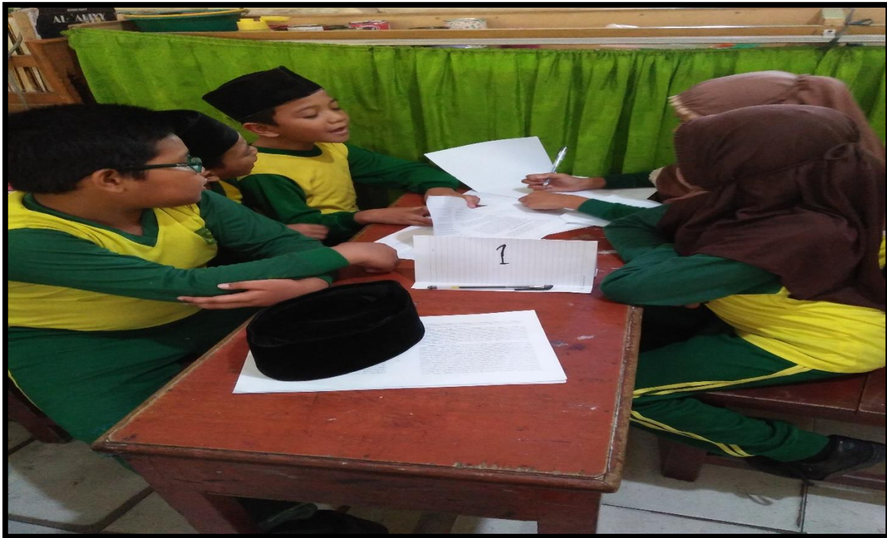
Gambar 5. Membuat pertanyaan di kertas yang telah guru berikan kepada siswa