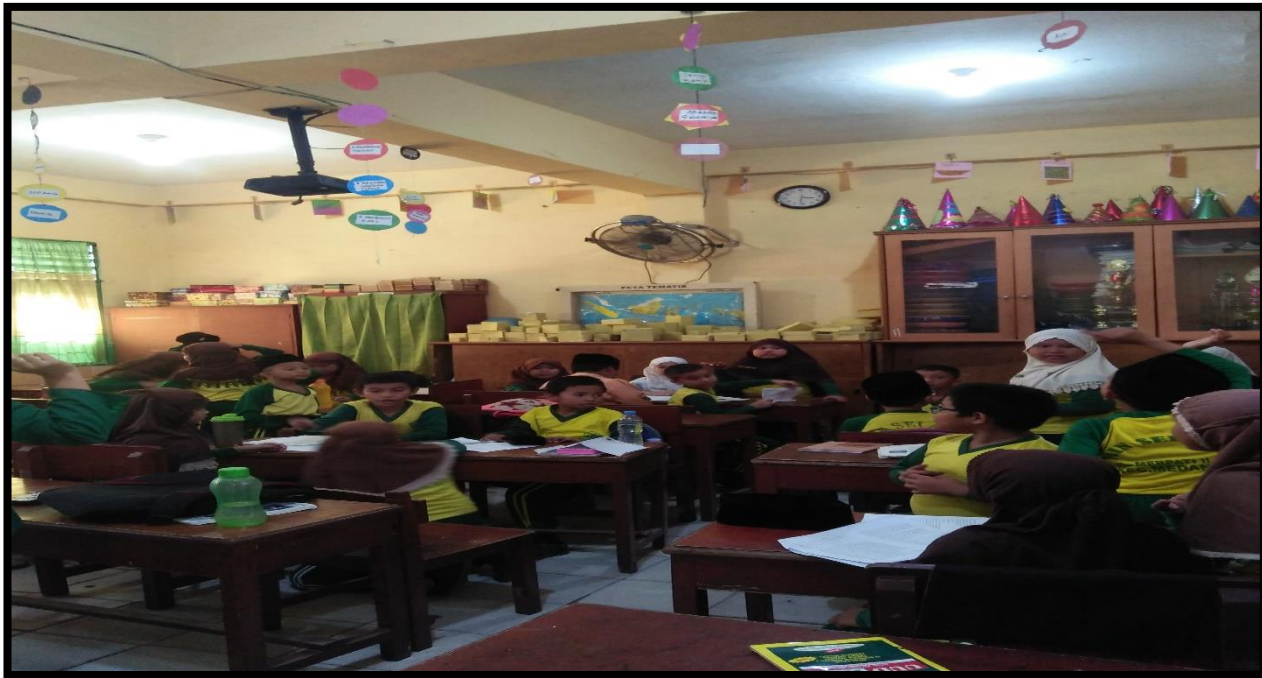
Gambar 7. Melempar bola yang berisi pertanyaan kekelompok lain