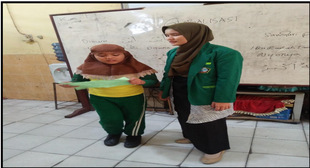
Gambar 8. Siswa sedang menjawab pertanyaan yang tertulis dalam kertas dan guru memberikan penguatan