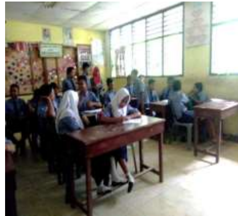
Siswa Mengerjakan Angket