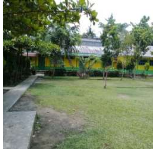
Gedung SMP Negeri 3