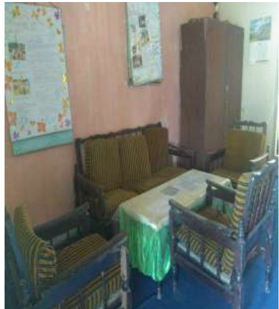
Ruang BK Tampak Dari Dalam