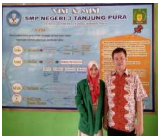
Foto Bersama Wakil Kepsek