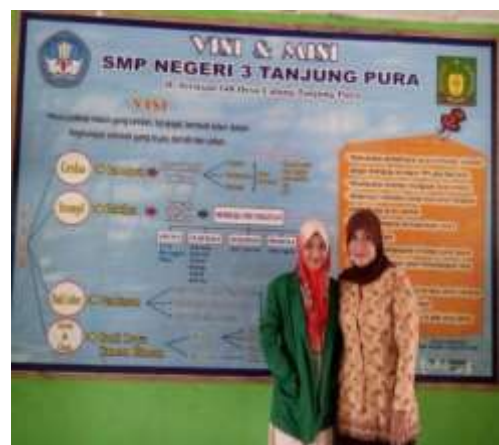
Foto Bersama Guru BK