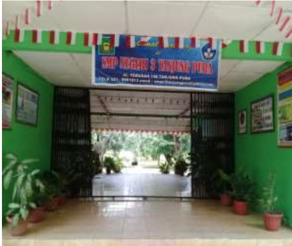
Gerbang SMP Negeri 3