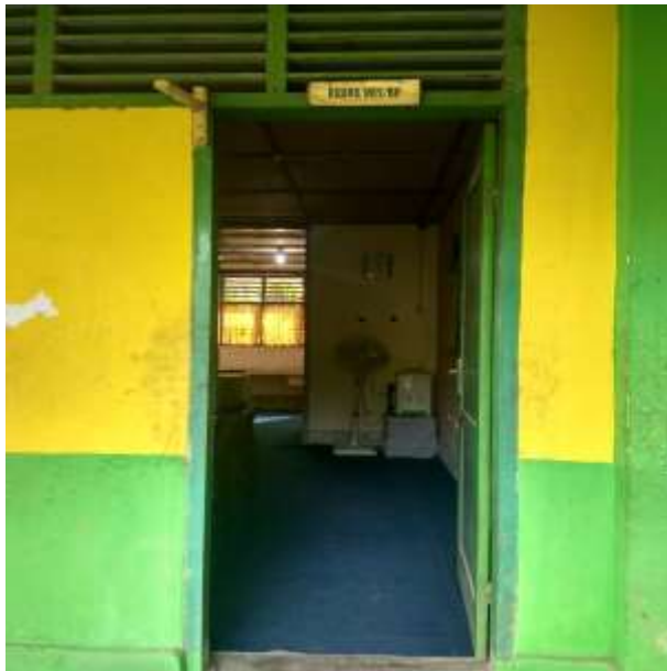
Ruang BK Tampak Dari Luar