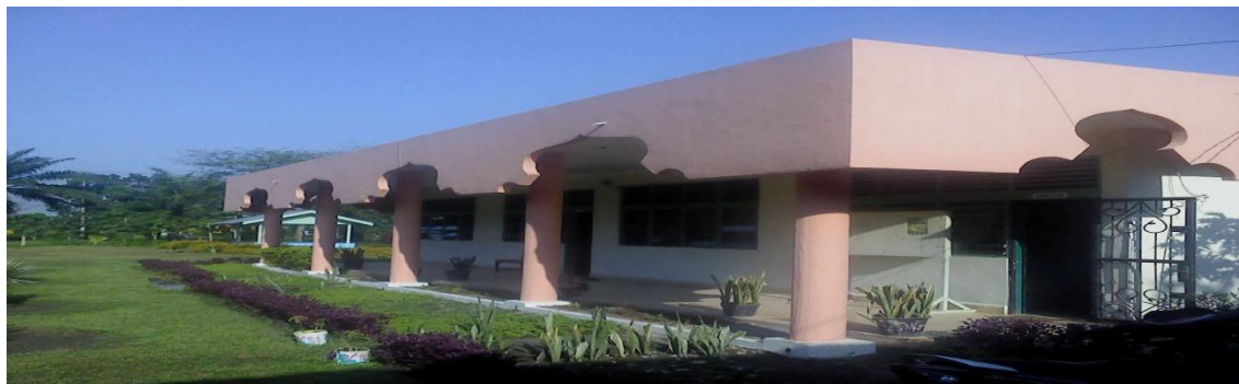
صورة غرفة المعلم