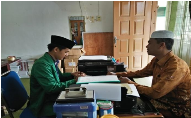
صورة بمدير المدرسة