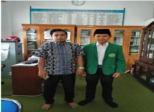
صورة برئيس الأعمال والمعلم