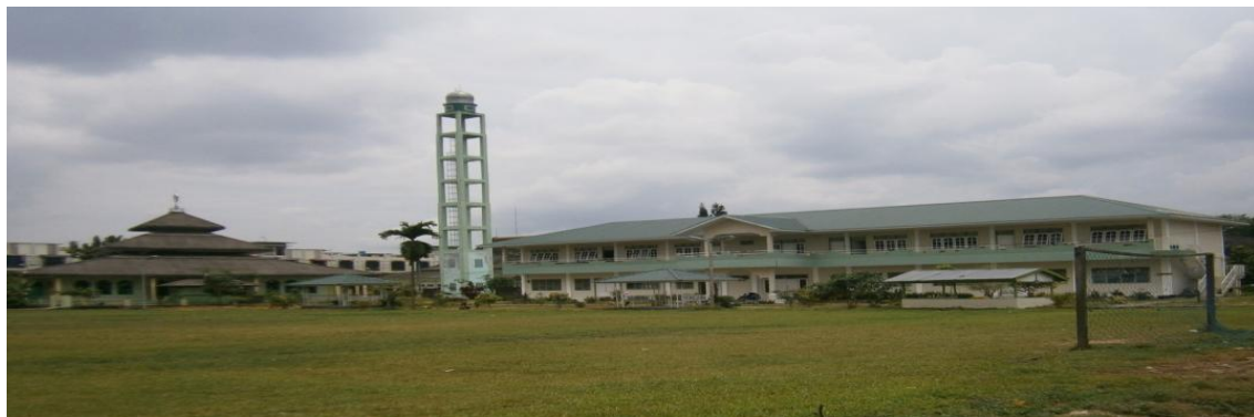
صورة المسجد والملاعب