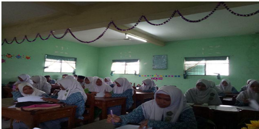
Suasana Pre Tes Awal