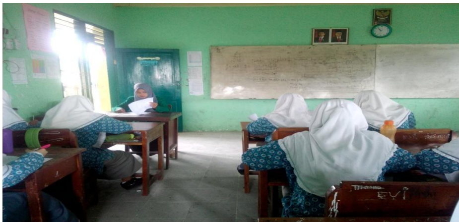
Suasana Pre Tes II MA Kelas X Al-ittihadiyah Bromo