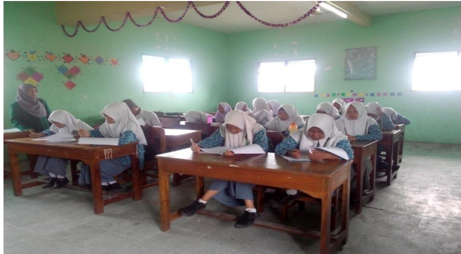
Suasana Belajar Mengajar Dengan Menggunakan Metode Simulasi