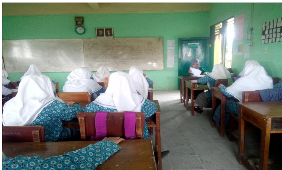
Suasana Kegiatan Belajar Mengajar Waktu Menyampaikan Materi Perekonomian Dalam Islam Melalui Metode Simulasi