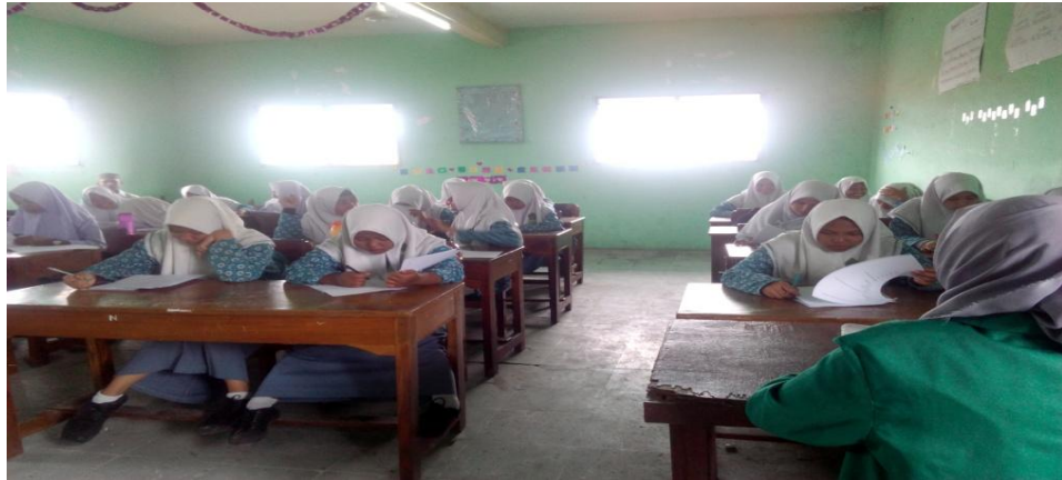
Suasana Pre Tes Siklus II