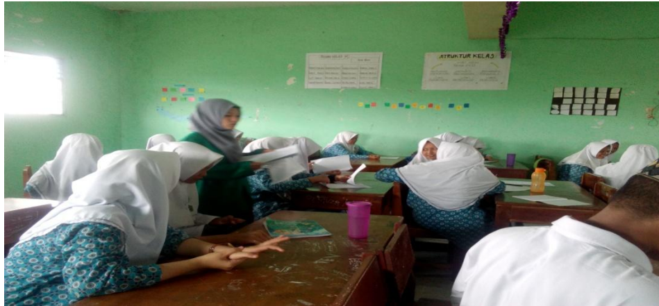
Suasana KBM Kelompok