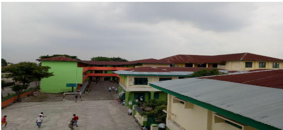
Suasana Sekolah Attihadiyah