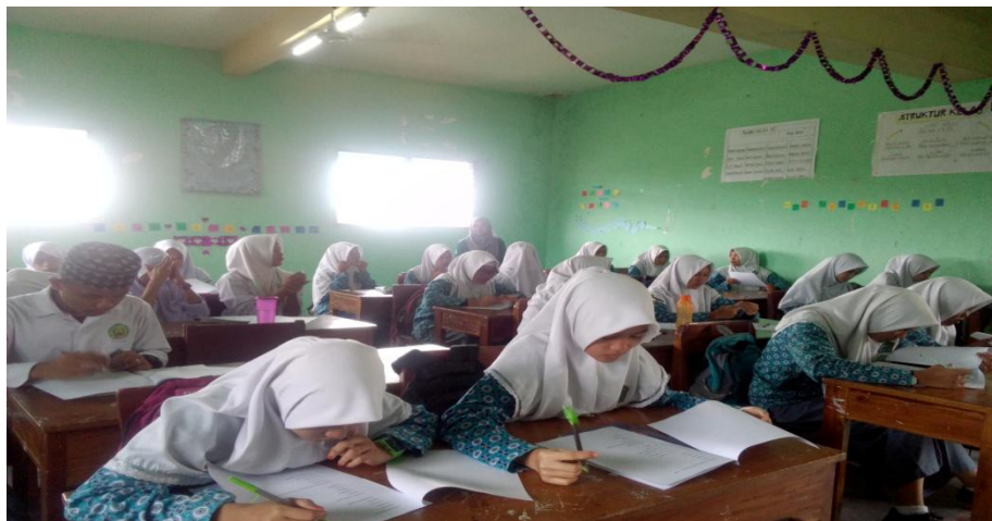
Suasana Pre Tes Siklus II Al-ittihadiyah Bromo Kelas X MA