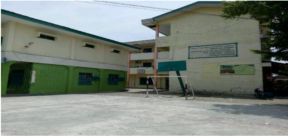
Sekolah Al-ittihadiyah Bromo Tingkat MA