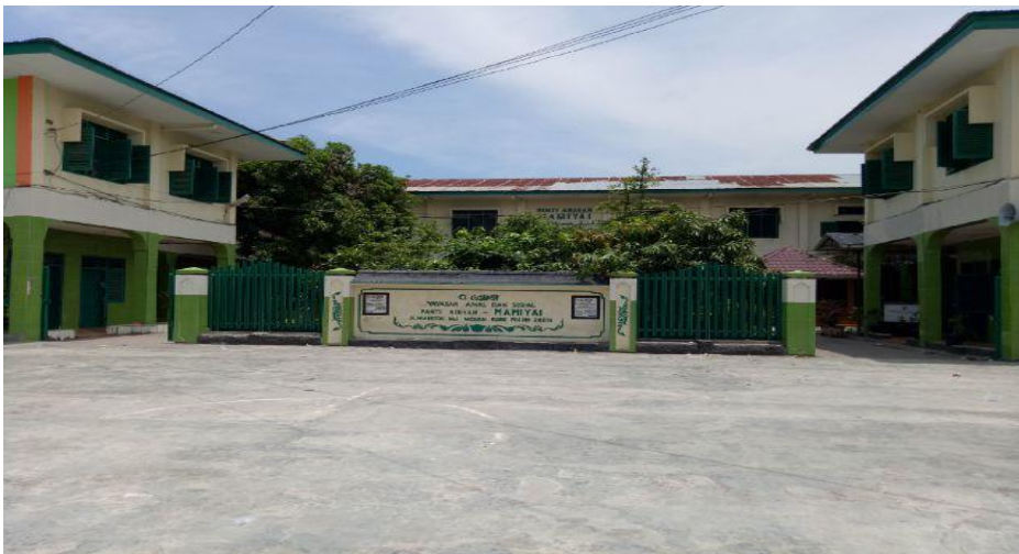
Gedung Panti Asuhan Bromo