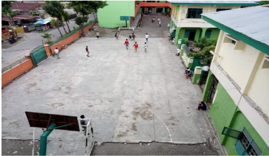
Sekolah Al-ittihadiyah Bromo

Foto Aktivitas Belajar Siswa dari Siklus I Sampai Siklus II