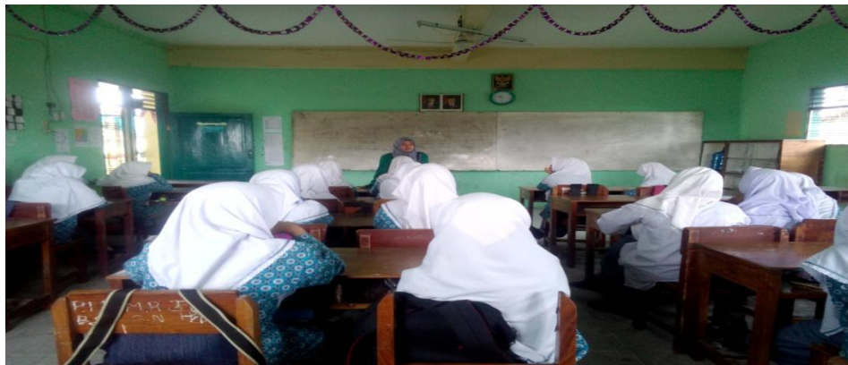
Suasana Menjelaskan Materi Perekonomian Dlama Islam