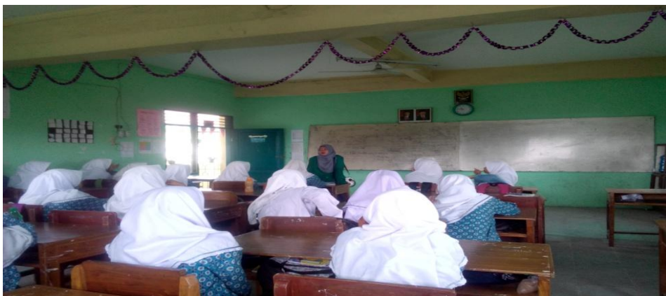
Suasana Saat Mempraktekkan Metode Simulasi