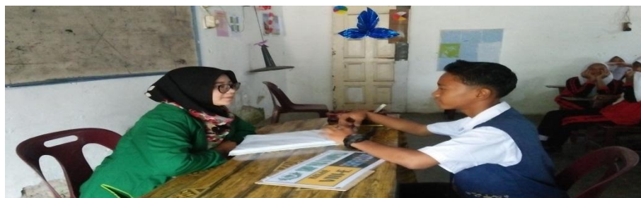
MELAKUKAN LAYANAN KONSELING INDIVIDU BERSAMA SAMPEL