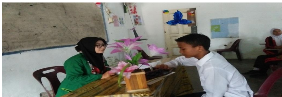
MELAKUKAN LAYANAN KONSELING INDIVIDU BERSAMA SAMPEL