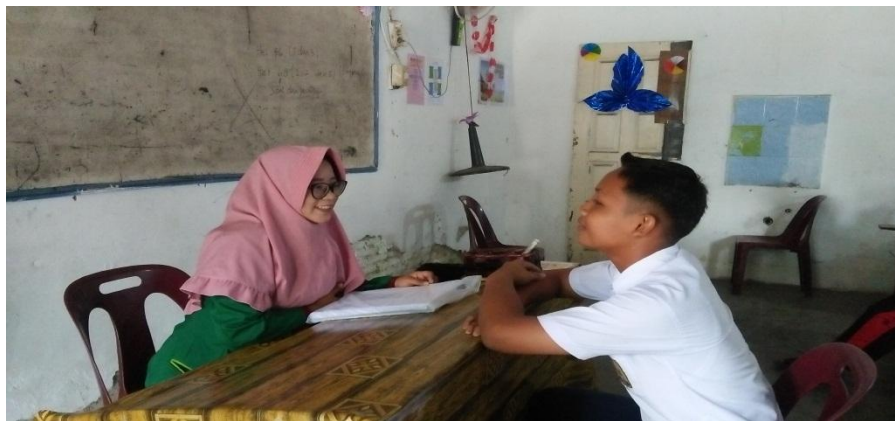
MELAKUKAN LAYANAN KONSELING INDIVIDU BERSAMA SAMPEL