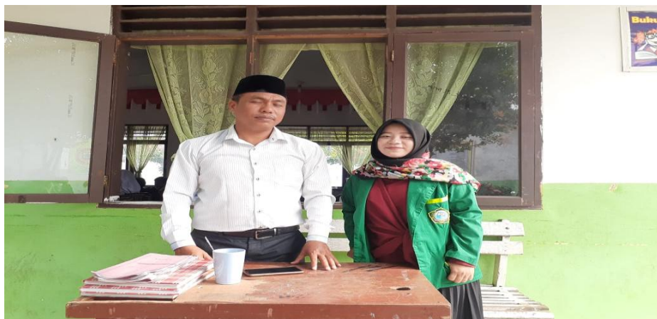
BERSAMA GURU BK