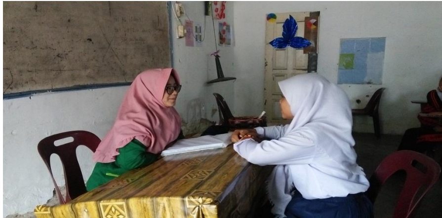
MELAKUKAN LAYANAN KONSELING INDIVIDU BERSAMA SAMPEL