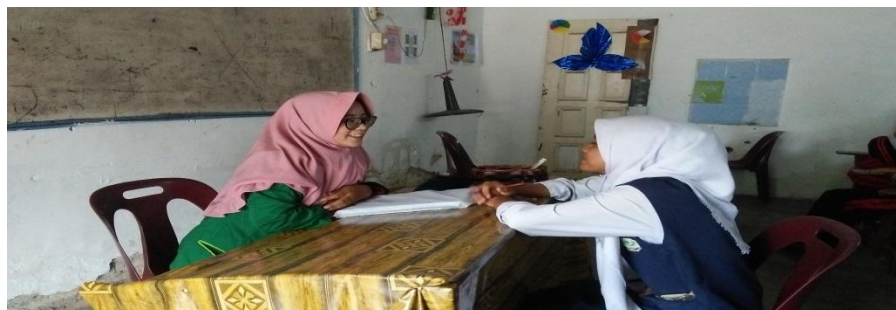
MELAKUKAN LAYANAN KONSELING INDIVIDU BERSAMA SAMPEL