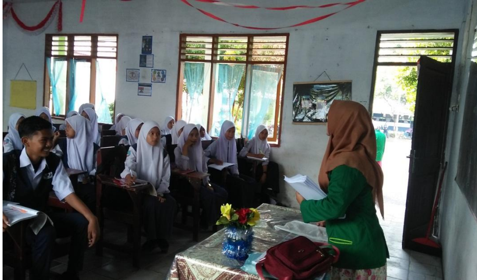
MELAKUKAN SEBARAN ANGKET