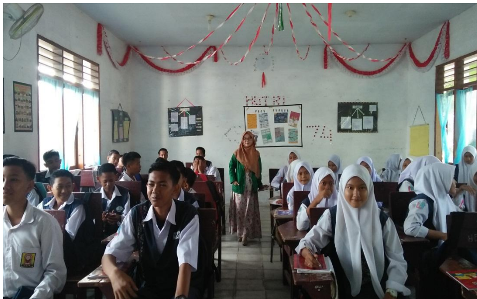
BERSAMA SAMPEL ANGKET