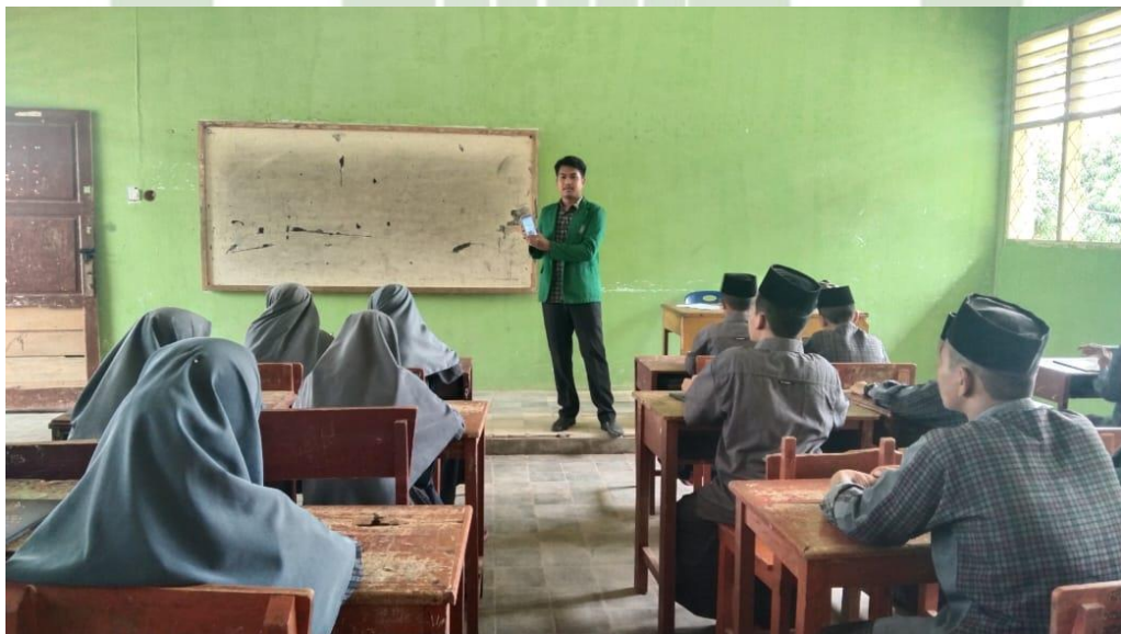
Foto menjelaskan media aplikasi Timeline