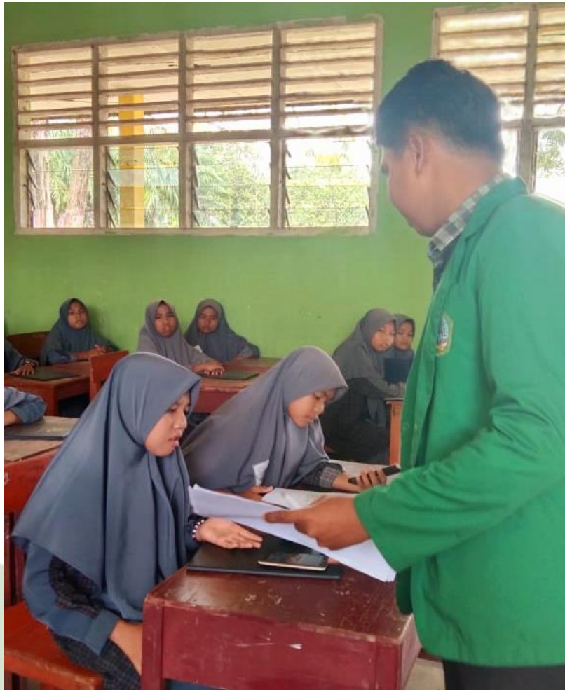
Foto Pembagian Angket