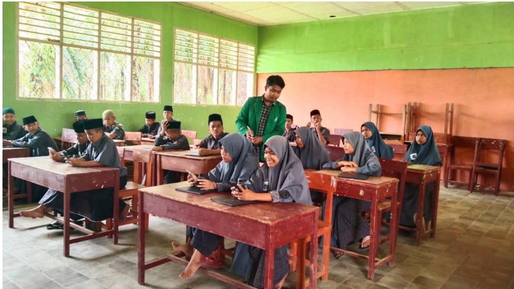
Foto memberikan media aplikasi Timeline