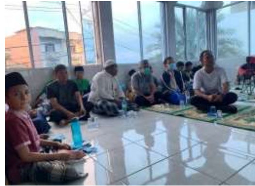
Kegiatan rutinitas Jam'iyah Ruqyah Aswaja kota medan Ruqyah Massal