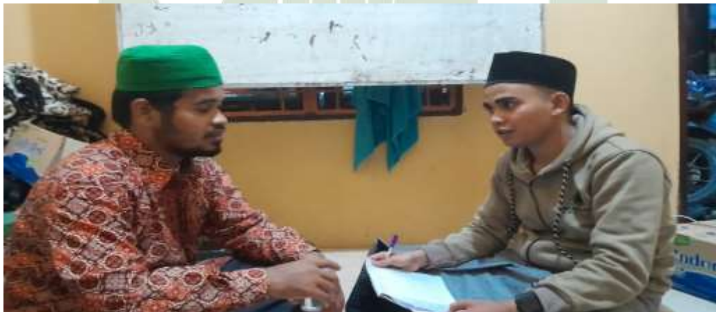
Wawancara bersama sekretaris Jam'iyah Ruqyah Aswaja kota medan