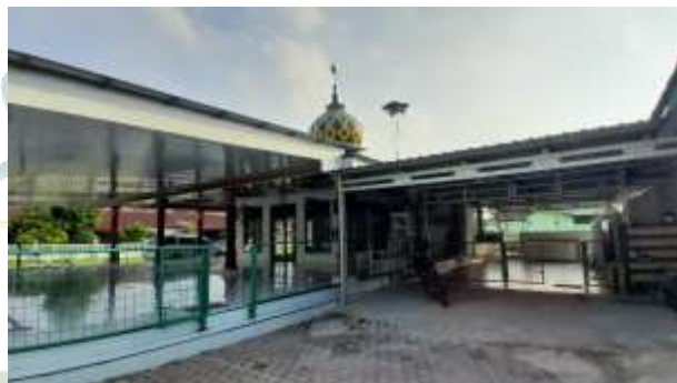
Sekretariat yayasan Jam'iyah Ruqyah Aswaja kota medan