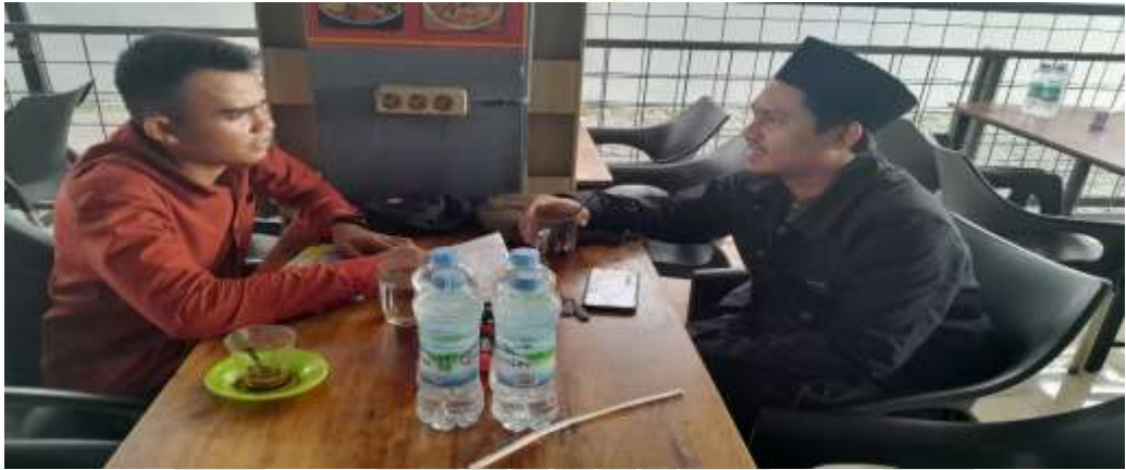
Wawancara bersama ketua Jam'iyah Ruqyah Aswaja kota medan