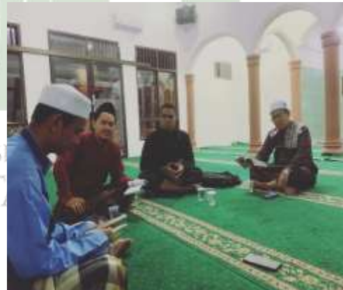
Kegiatan rutinitas Jam'iyah Ruqyah Aswaja kota medan Rotibul haddad