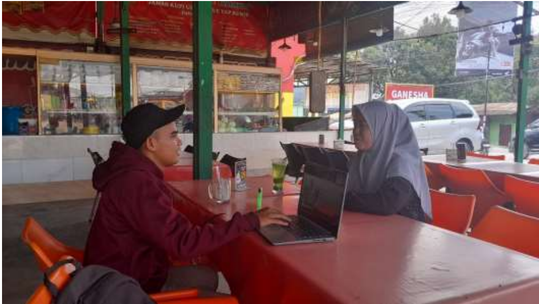
Wawancara bersama pasien yang stres dan cemas