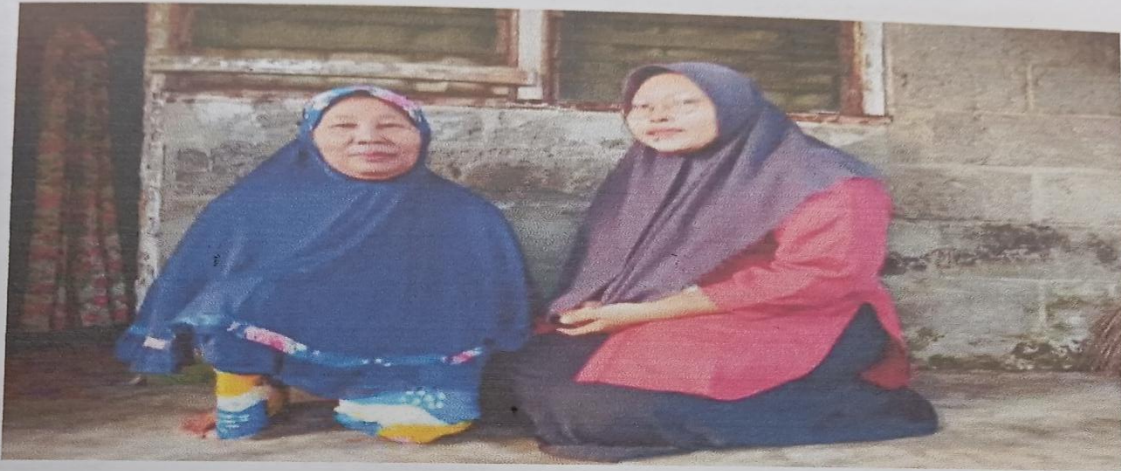
Wawancara wakil ketua pengajian