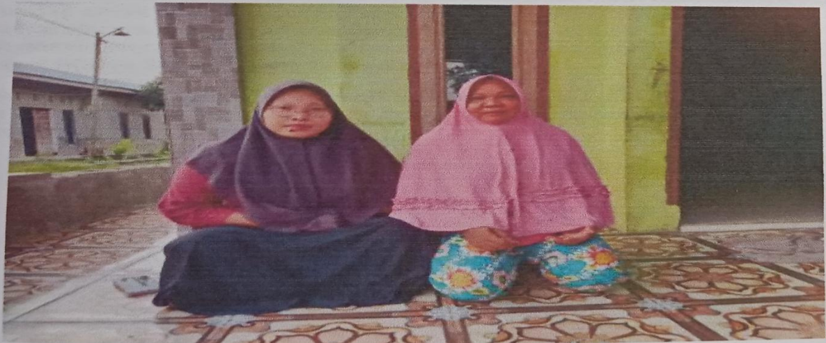
Wawancara sekretaris pengajian