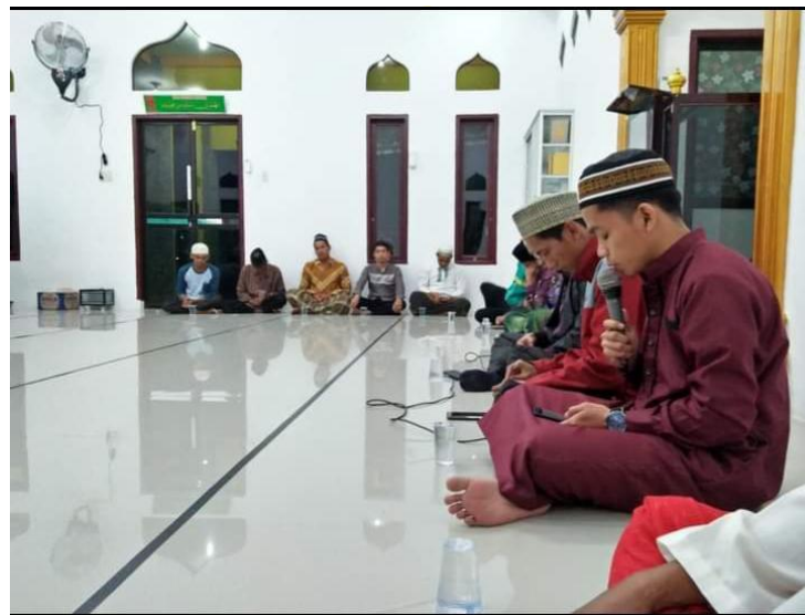
SUMATERA UTARA MEDAN