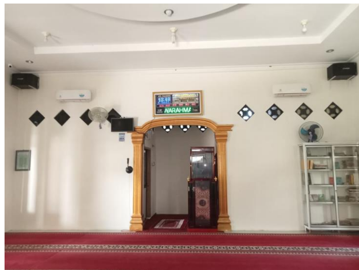
UNIVERSITAS ISLAM NEGERI