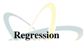
Variables Entered/Removed a