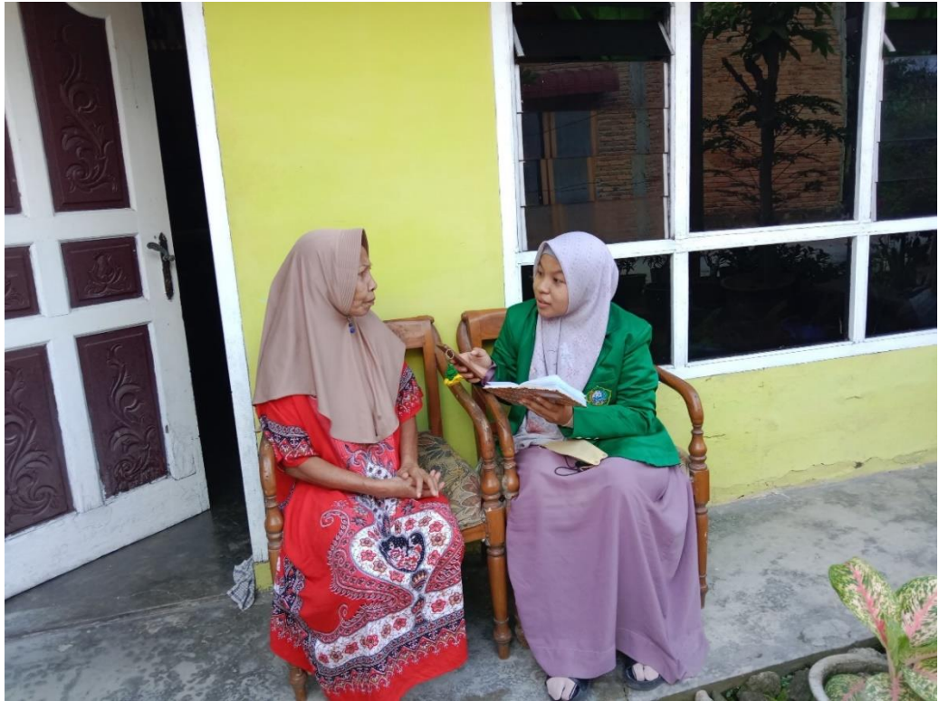
Wawancara Dengan Ibu Sainik 8 Juli 2024