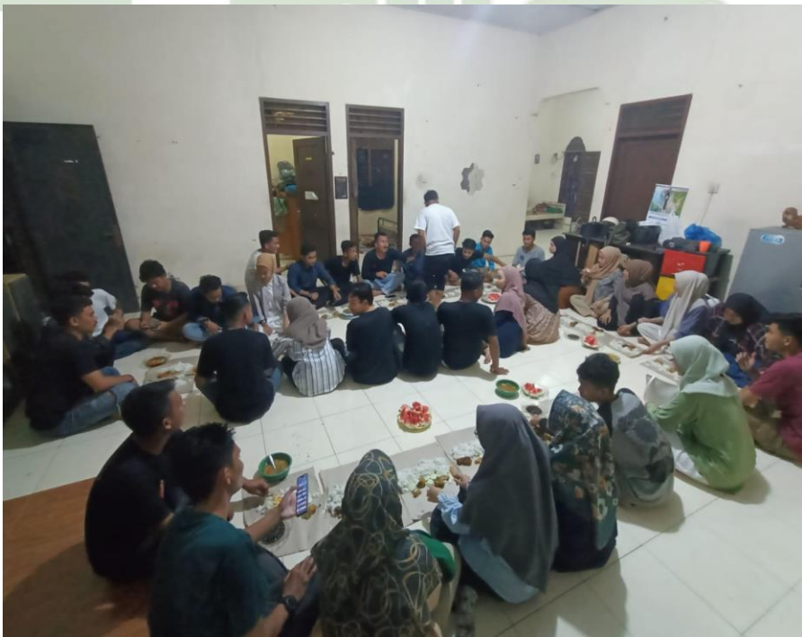
Gambar 2.1. Rapat Bersama Remaja Desa Batang Gunung.