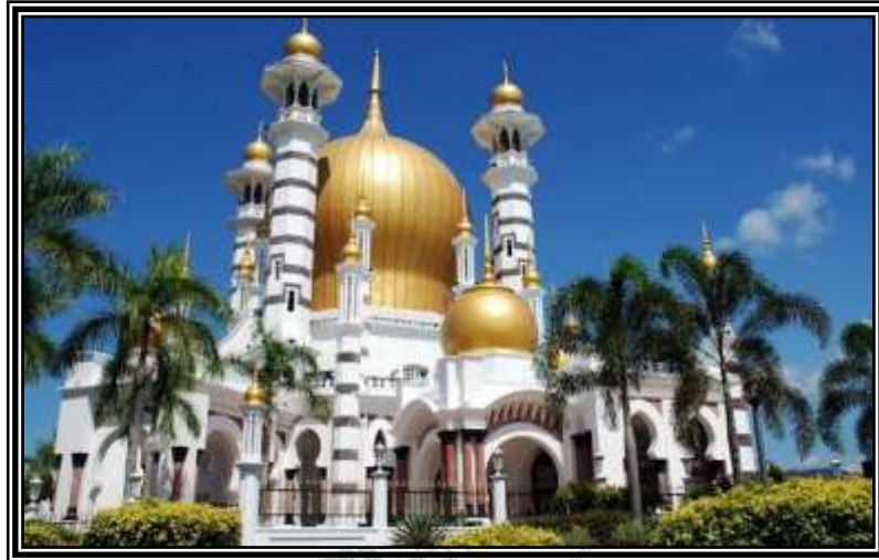
Gambar 2. Rumah Ibadah yang ada di Kecamatan Tanjung Morawa