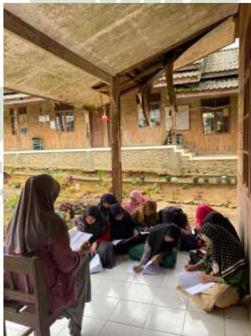
Gambar 9. Santri sedang mandiri belajar dan mengerjakan tugas