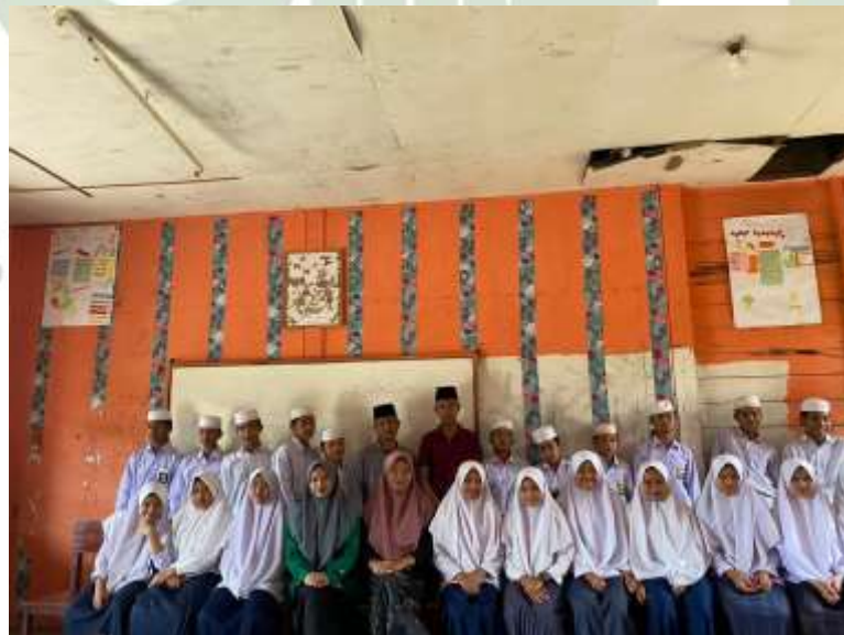
Gambar 7. Santri dan santriwati