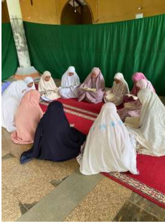
Gambar 10. Santri sedang mandiri dalam membaca dan hafalan qur'an