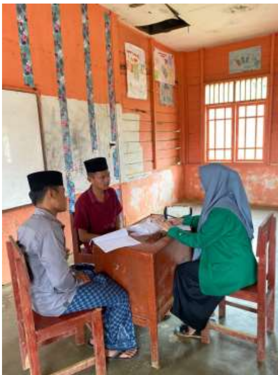
Gambar 14. Bersama guru dan pengasuh

UNIVERSITAS ISLAM NEGERI SUMATERA UTARA MEDAN