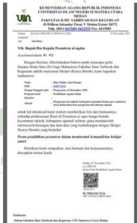
Gambar 1. Surat izin riset dari universitas