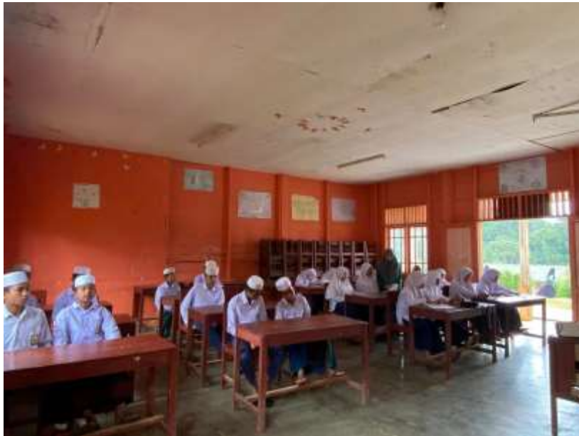
Gambar 8. Keadaan santri saat belajar