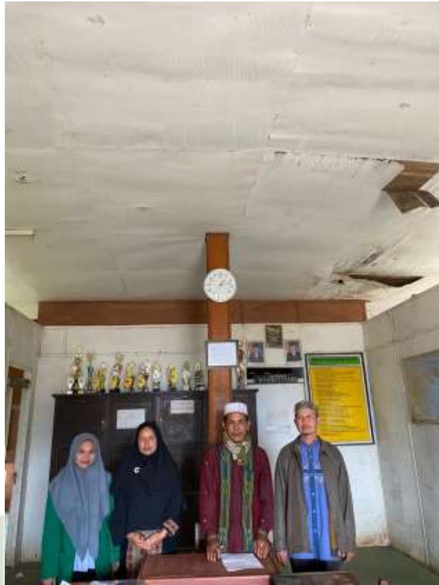
Gambar 6. Ketua yayasan, kepala madrasah dan pengasuh