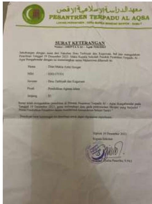
Gambar 2. Surat balasan riset dari pondok pesantren