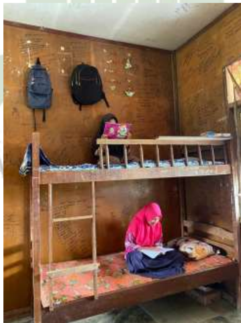
Gambar 11. Kamar santri