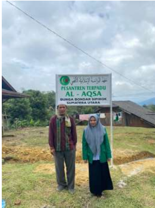
Gambar 4. Pimpinan yayasan pondok pesantren