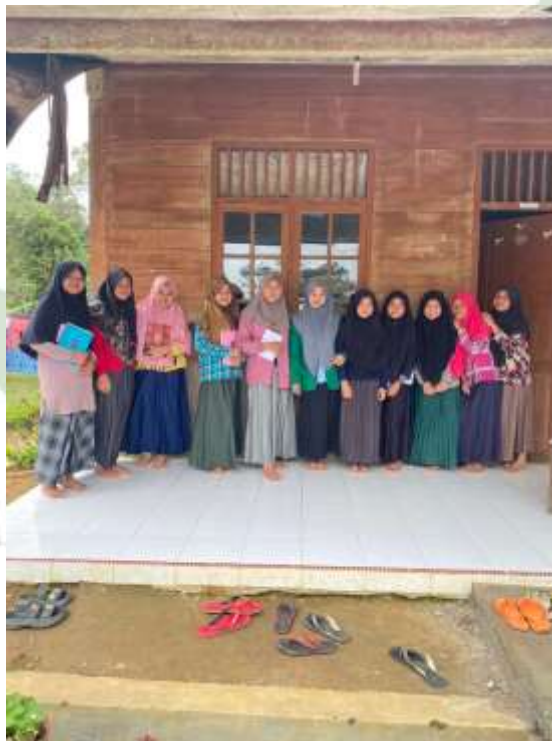
Gambar 13. Santriwati