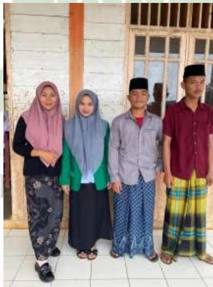
Gambar 5. Beberapa pengasuh pondok pesantren