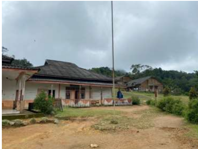
Gambar 12. Lingkungan dan tempat tinggal santri