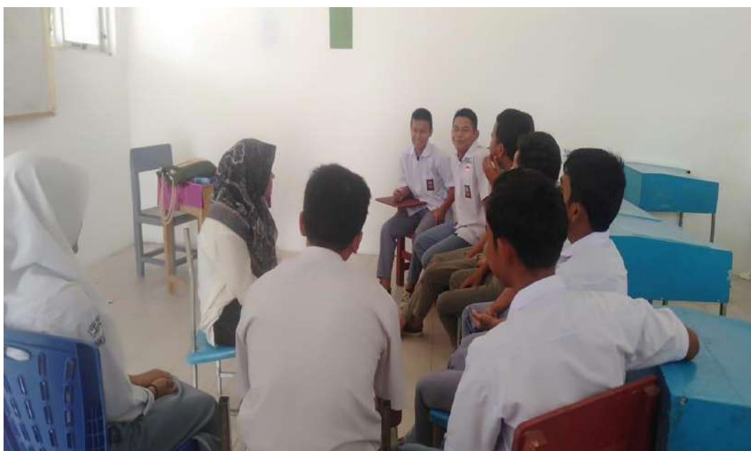
Wawancara dengan siswa