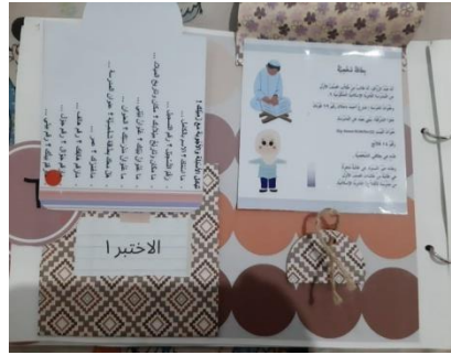
الشكل ٥,٤ الجزء الخلفي من سجل القصصات