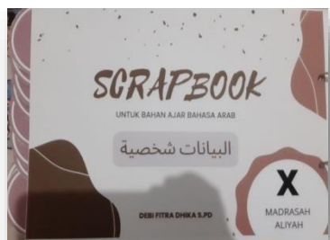
الشكل ٤,٢ محتويات دفتر القصاصات