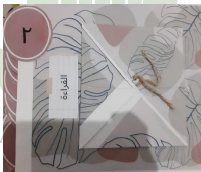
الشكل ٤,٤ محتويات دفتر القصاصات