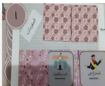
الشكل ٤,٣ محتويات دفتر القصاصات