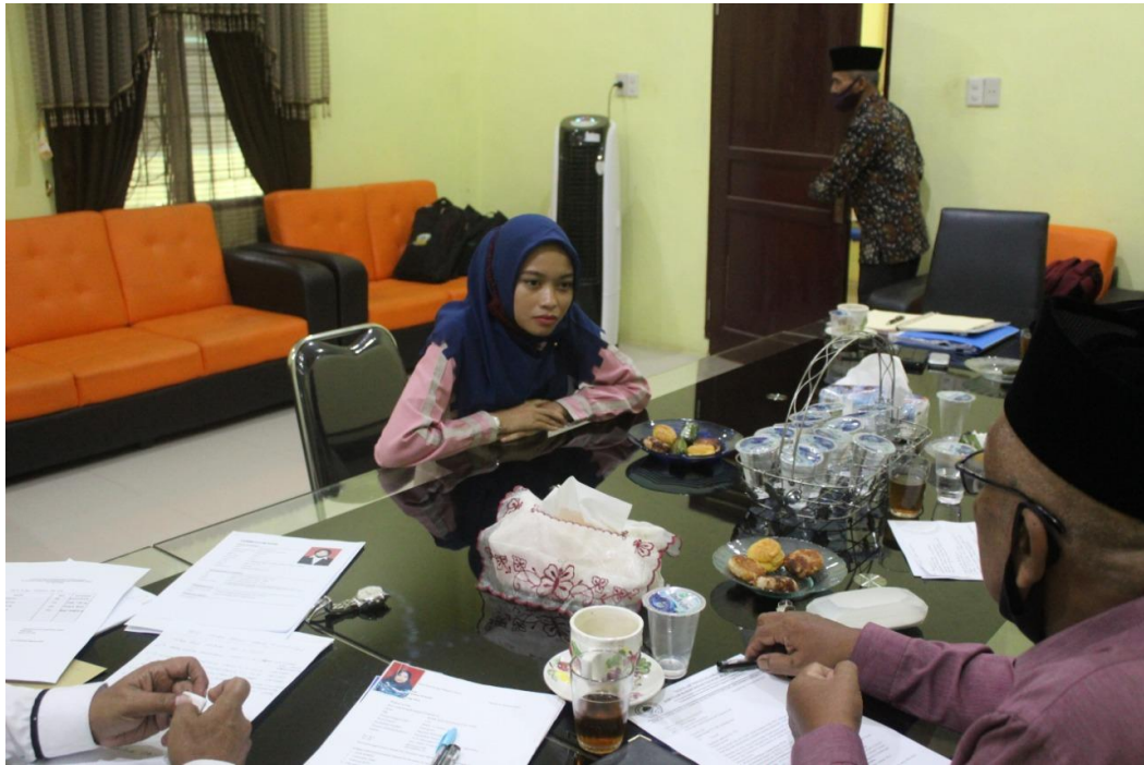
Gambar;4. Pertemuan dengan Ketua Yayasan -Pengumuman Hasil Seleksi