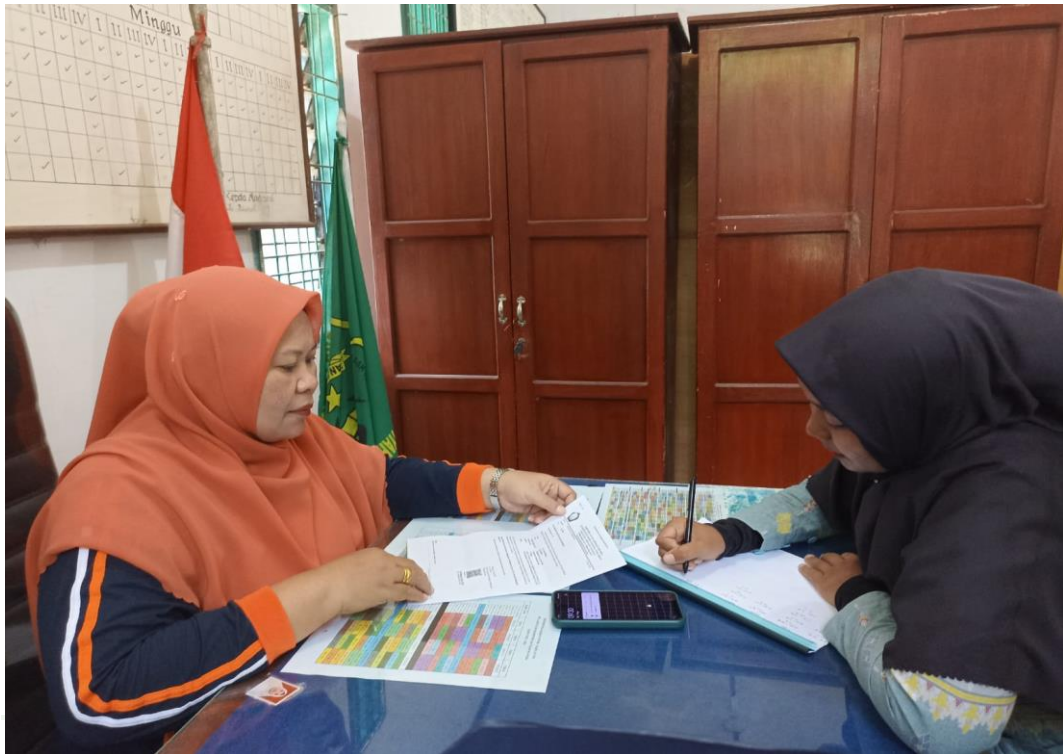
Gambar ; 1. Wawancara dengan Kepala Madrasah