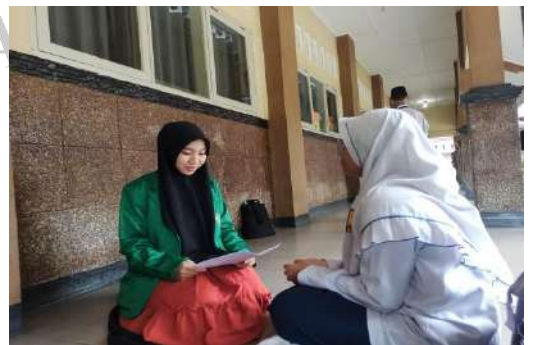
Wawancara dengan siswa dan siswi di SMP IT Nurul Ilmi Deli Serdang