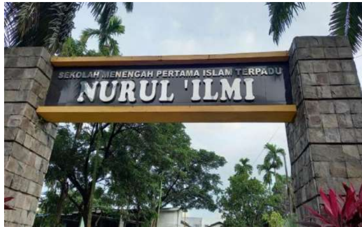
Lokasi penelitian di SMP IT Nurul Ilmi Deli Serdang