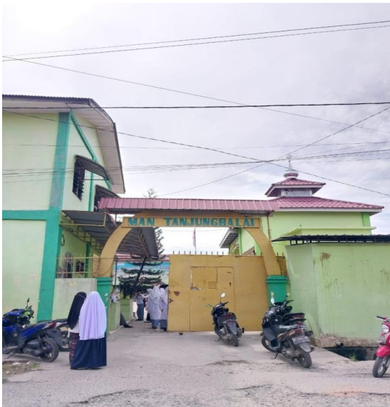
Gambar 1. MAN Tanjungbalai tampak dari depan