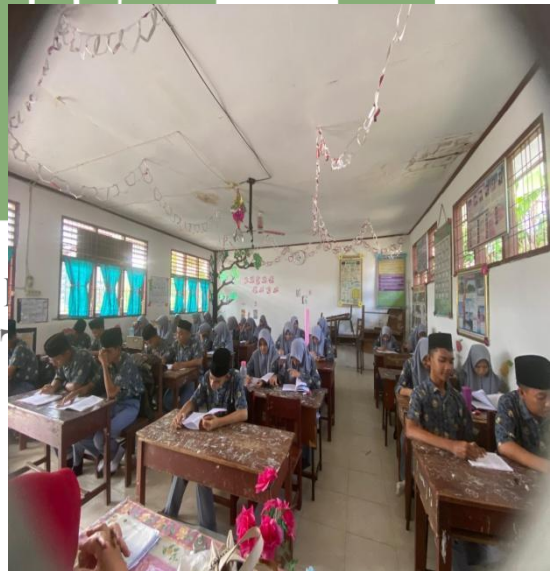
Gambar 4. Suasana kegiatan belajar di kelas