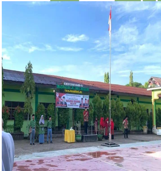
Gambar 3. Suasana kegiatan apel pagi