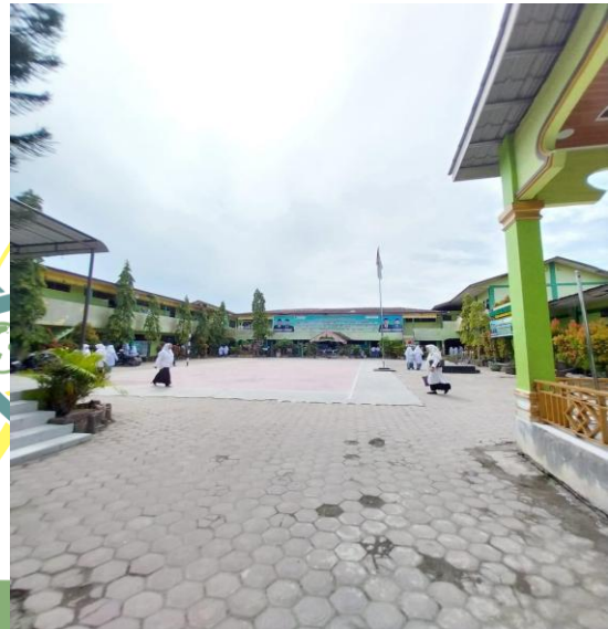
Gambar 2. Lapangan MAN Tanjungbalai