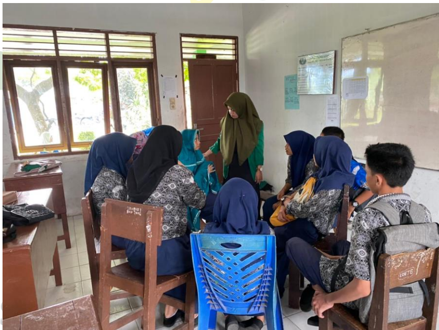
Pelaksanaan Layanan Bimbingan Karir