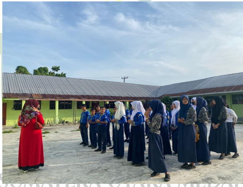
Apel Pagi Seluruh Siswa SMP PAB-10 Medan Estate