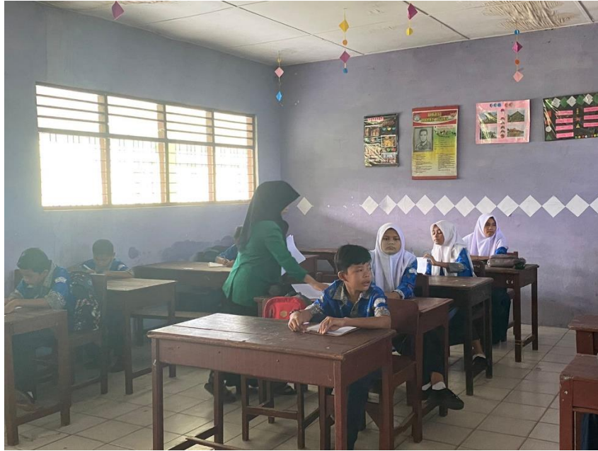
Pembagian Instrumen Angket Pre-Test