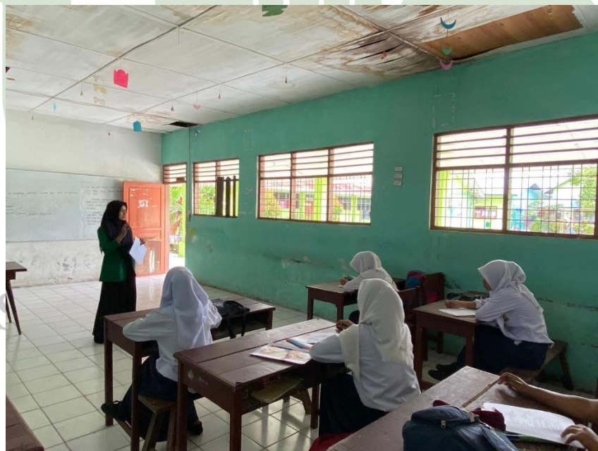
Penjelasan Mekanisme Pengerjaan Instrumen Angket Pre-Test