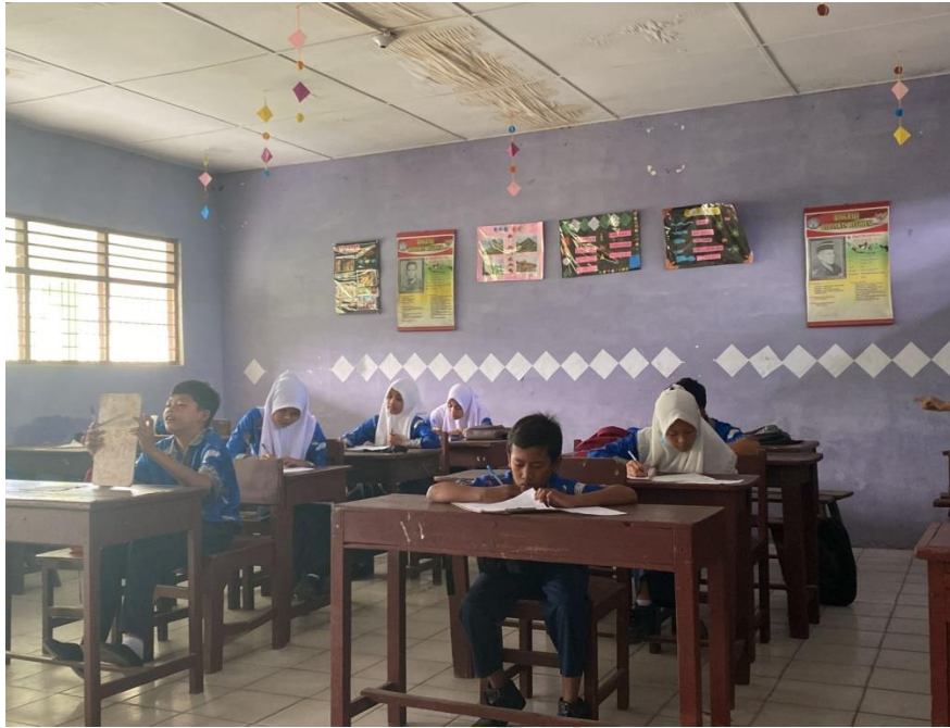
Proses Pengerjaan Instrumen Angket Post-Test