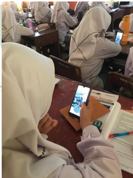
Figure 6. 4 Learning Using Webtoon Apps