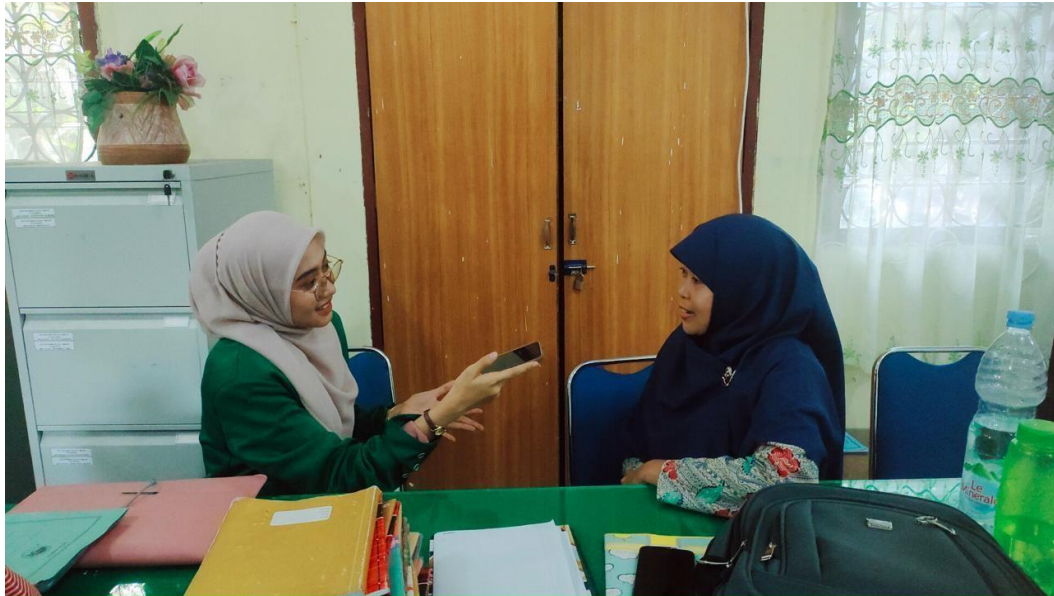
Figure 6.7 Semi Structured Interviews