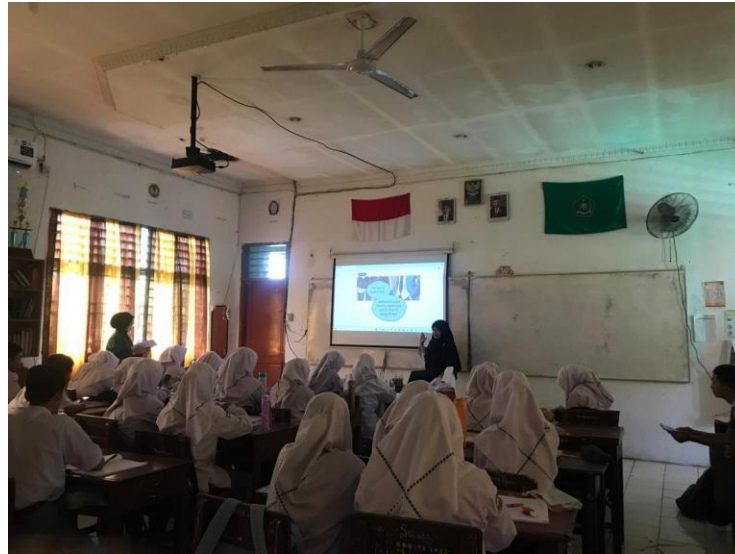
Figure 6. 3 Teacher explains the lesson