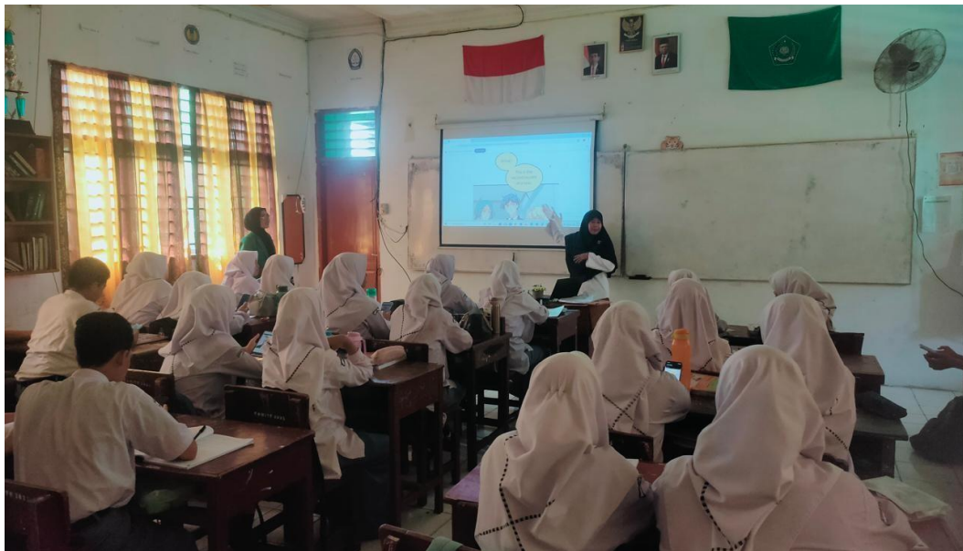
Figure 6.5 Teacher Explains Webtoon Content