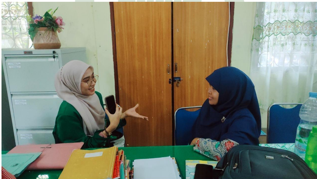
Figure 6.6 Semi Structured Interviews