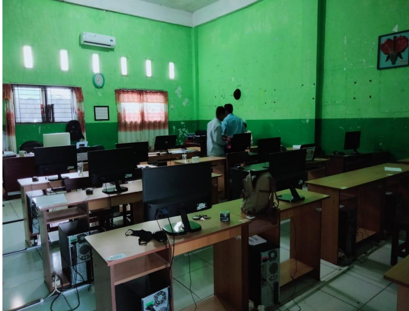
Ruangan Kelas SMP T Al-Hijrah