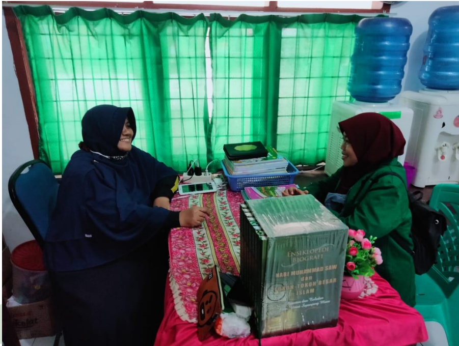
Wawancara dengan wakil kepala sekolah bidang sarana dan prasarana