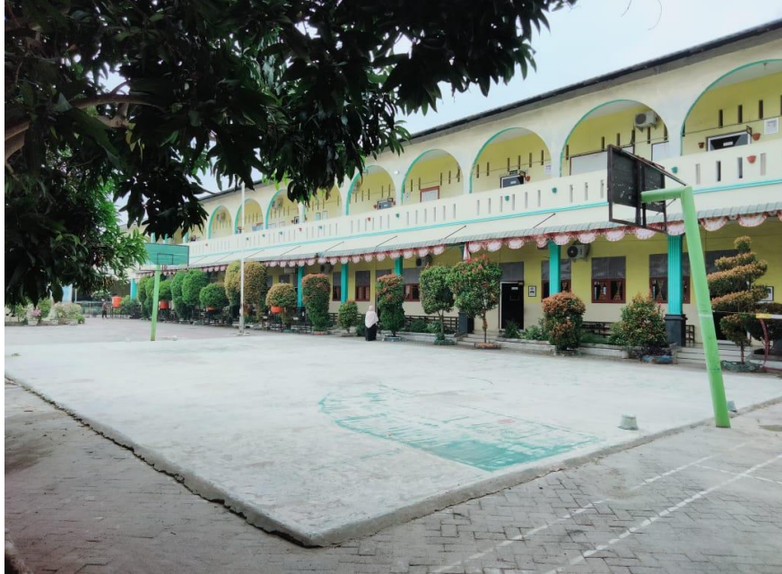
Kantor Sekolah SMP T Al-Hijrah