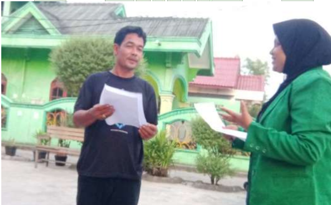
Lampiran 2 Wawancara Bersama Masyarakat Menteng Raya