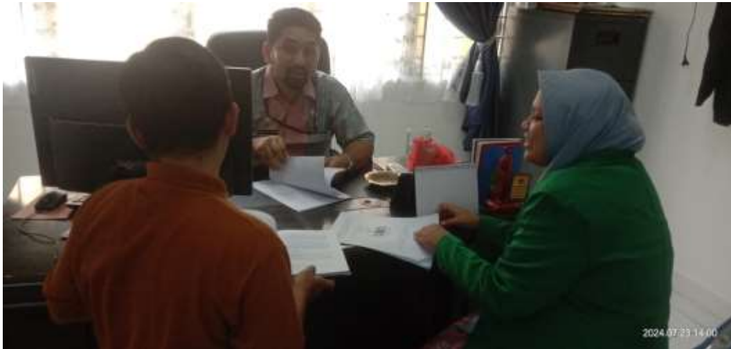
Lampiran 1 Wawancara Bersama Pak Lurah Medan Denai