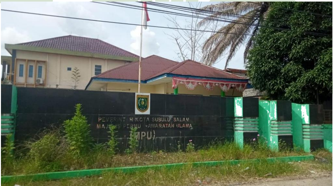
Kantor Majelis Permusyawaratan Ulama (MPU) Kota Subulussalam