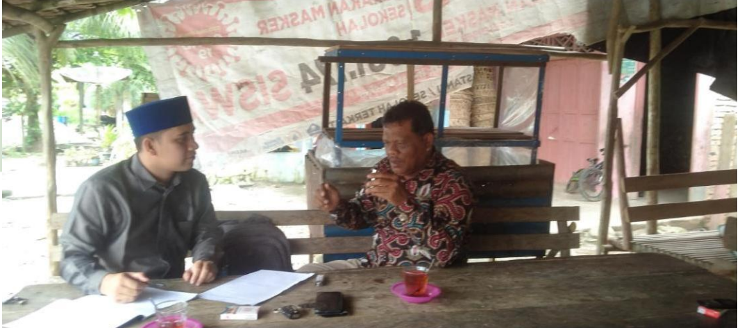
Wawancara Dengan Wakil Ketua I Majelis Adat Aceh (MAA) Kota Subulussalam

UNIVERSITAS ISLAM NEGERI SUMATERA UTARA MEDAN