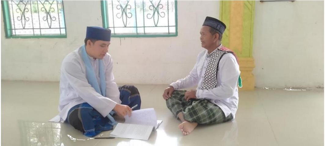
Tokoh adat Kota Subulussalam