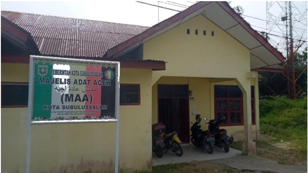
Kantor Majelis Adat Aceh (MAA) Kota Subulussalam