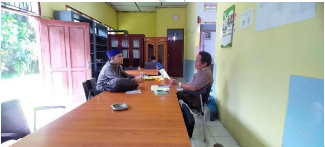
Wawancara dengan Tokoh adat kota Subulussalam

UNIVERSITAS ISLAM NEGERI SUMATERA UTARA MEDAN