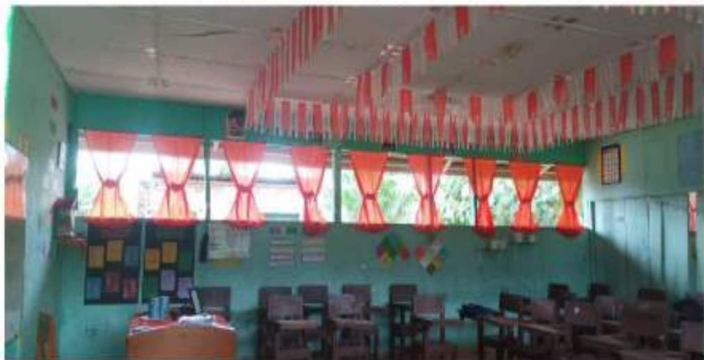
Ruang Belajar Tampak Dalam