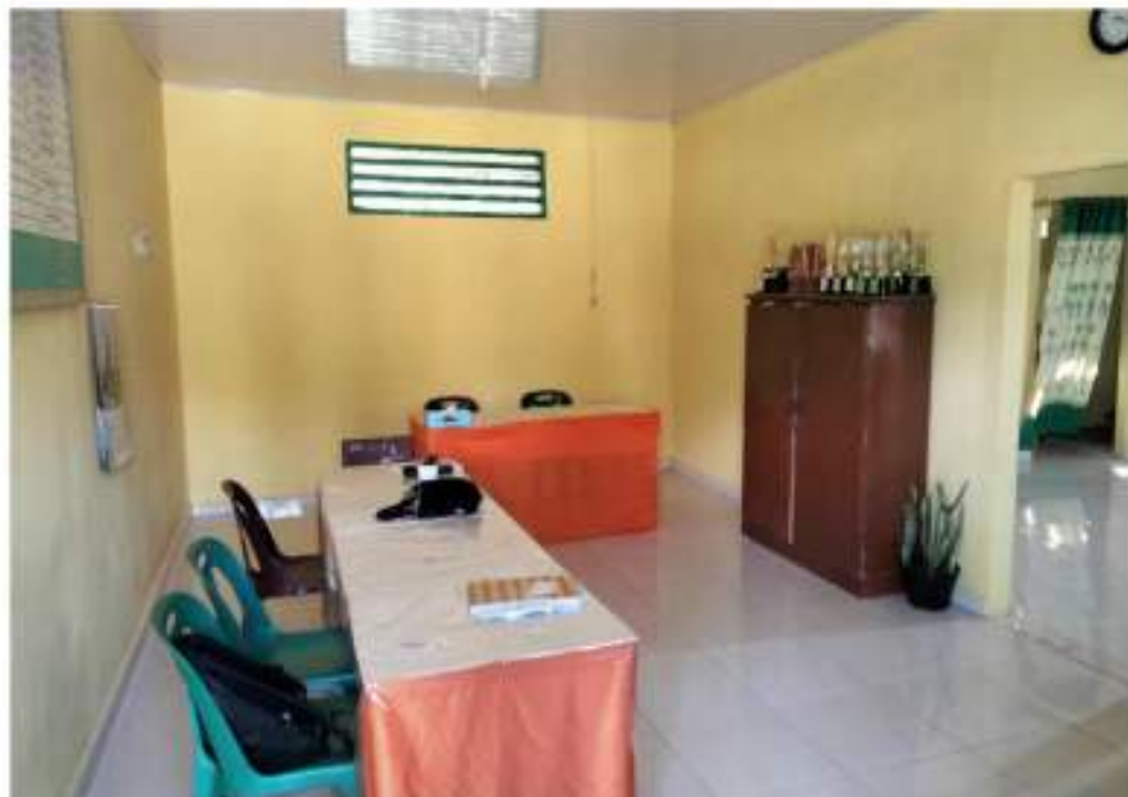
Ruang Guru dan TU