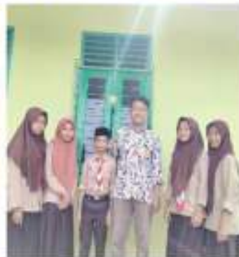
Foto Dengan Informan Penelitian