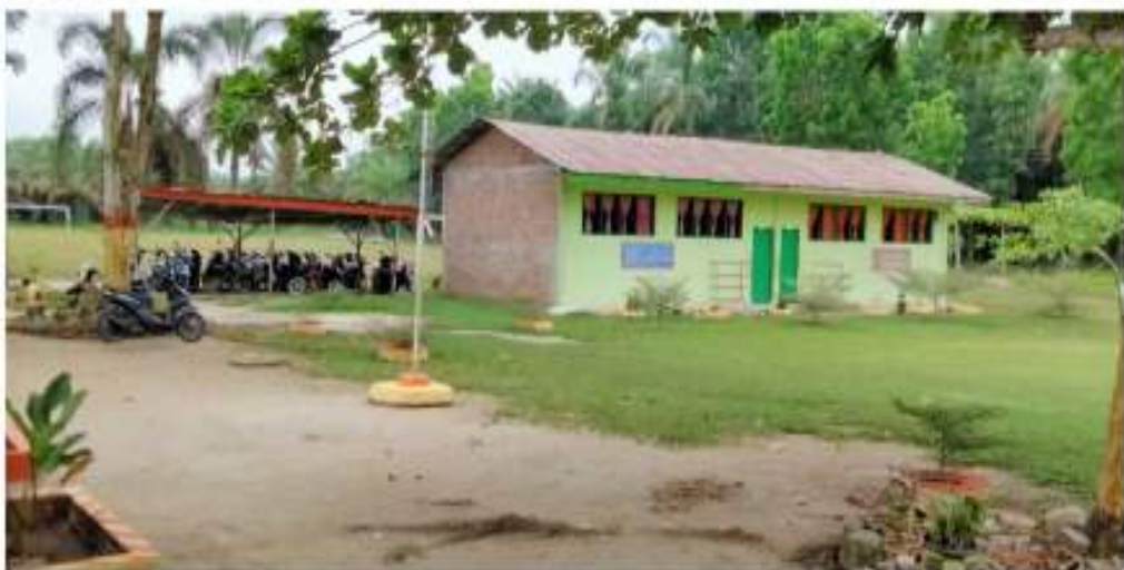
Ruang Belajar Tampak Luar