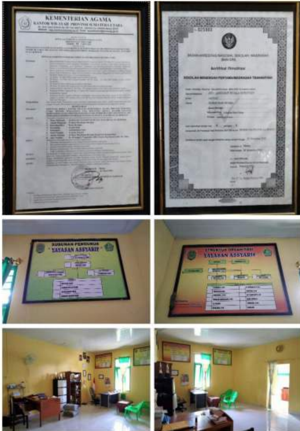
Ruang Kepala Sekolah