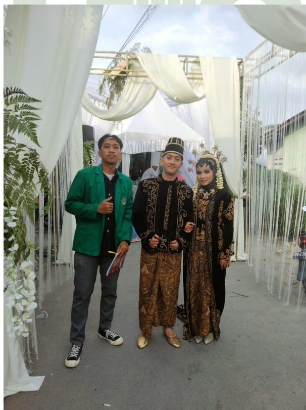
Gambar. Foto bersama masyarakat yang sedang melaksanakan tradisi ngidek endog