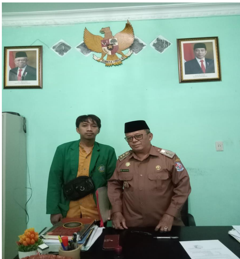
SUMATERA UTARA MEDAN Gambar. Foto bersama Kepala Desa Manunggal.