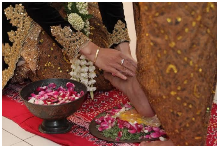
Gambar. Tradisi Ngidek endog