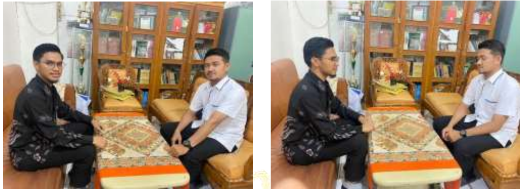
Gambar 1: Wawancara Dengan Wakil Kepala Madrasah Bid. Kesiswaan