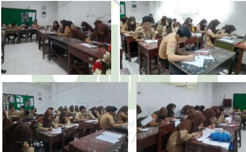
Gambar 2: Pengisian Himpunan Data Dan AUM