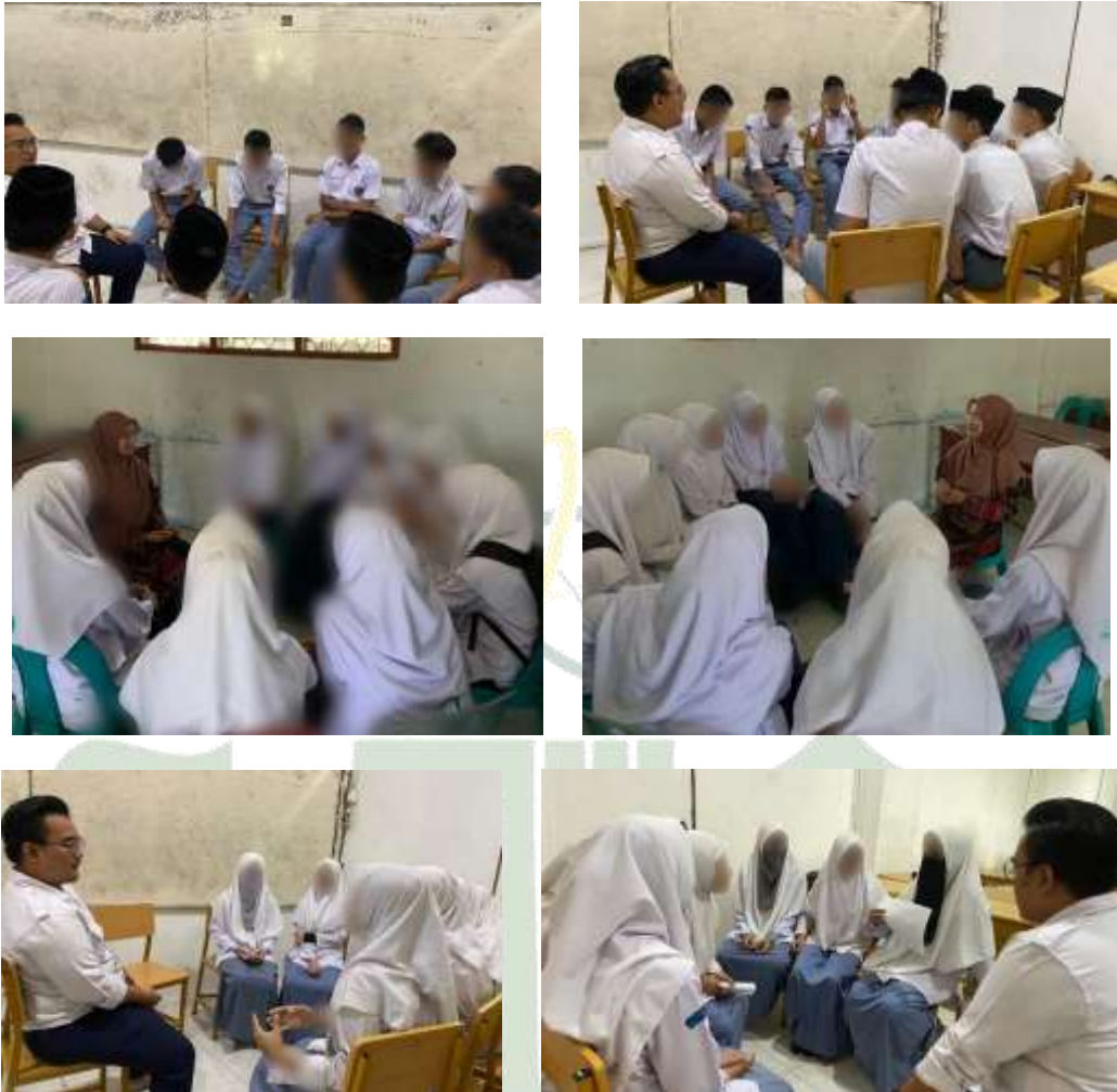
Gambar 3: Pelaksanaan Layanan Konseling Kelompok UNIVERSITAS ISLAM NEGERI SUMATERA UTARA MEDAN