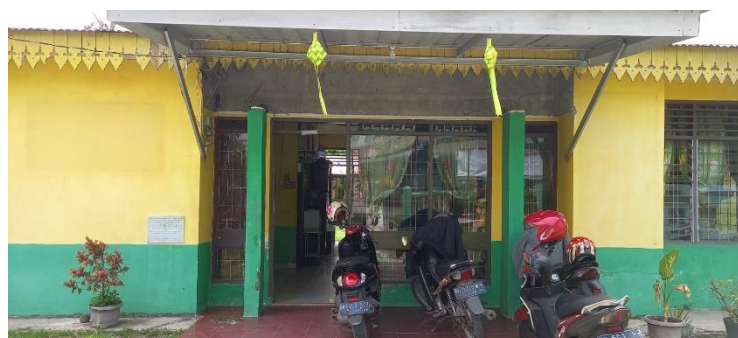
Gambar 12: Bagian Depan Kantor KUA Kecamatan Hamparan Perak