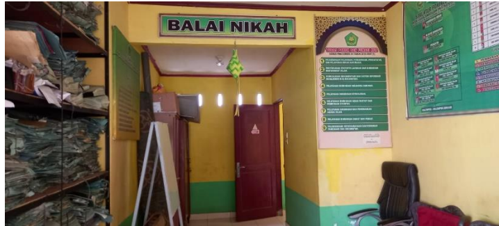
Gambar 13: Balai Nikah KUA Kecamatan Hamparan Perak.