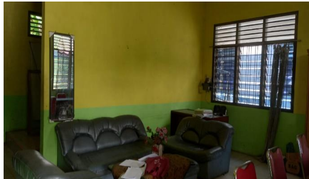
Gambar 3 dan 4: Suasana Kantor Urusan Agama Kecamatan Sibolangit