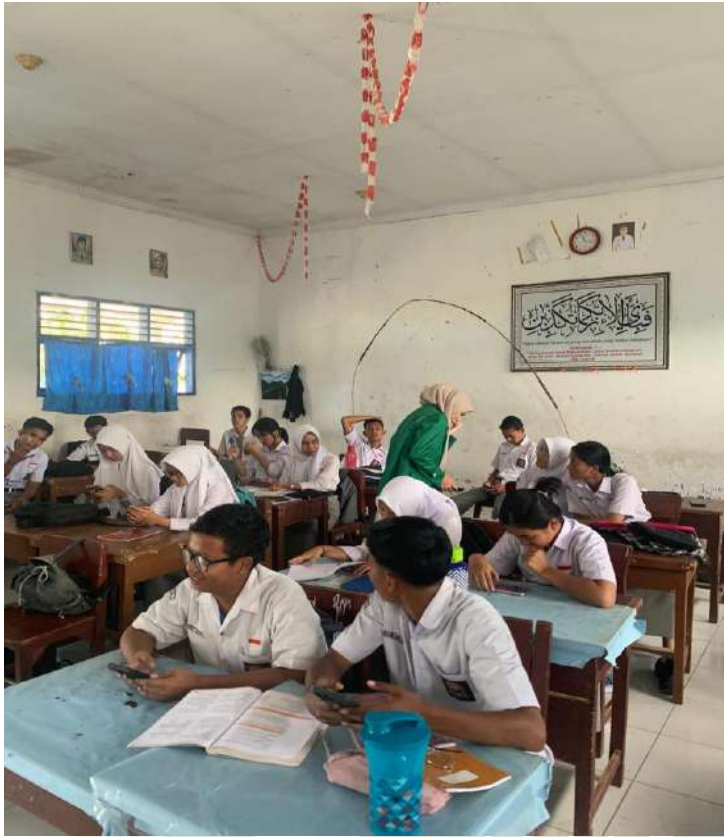
Lampiran 9 Pemberian Post-test