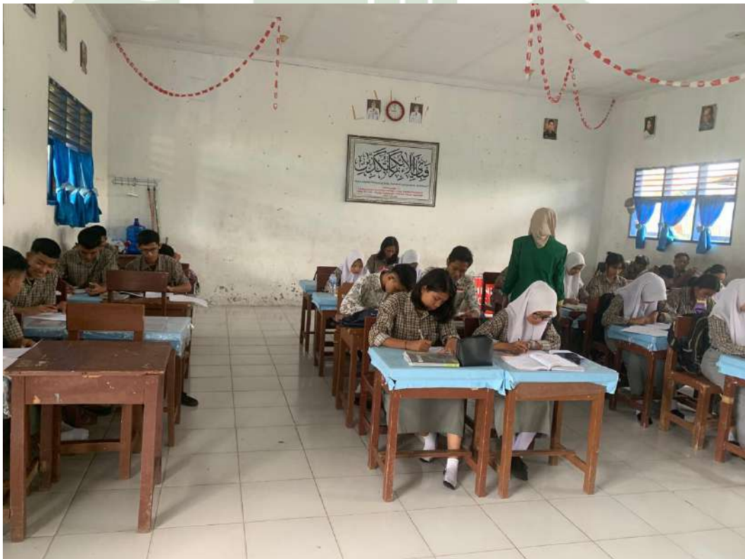
Lampiran 6 Dokumentasi Pemberian Pre-test