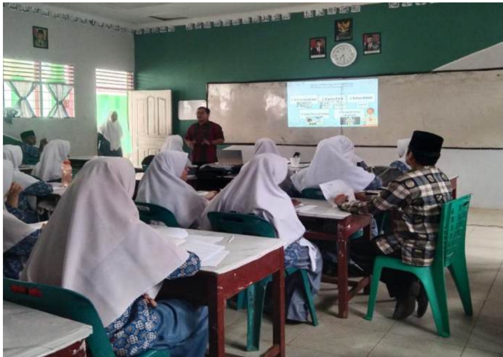
Foto Bersama Siswa Kelas XI IPA 1 Digital