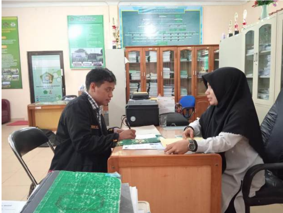
Wawancara dengan Siswa