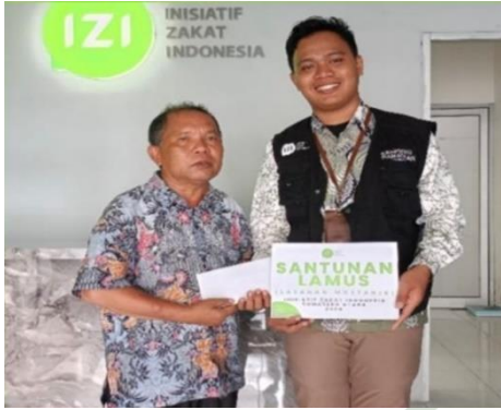
Penyerahan bantuan LAMUS berupa bantuan ekonomi dan akomodasi