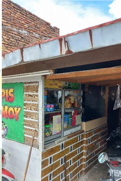
Foto usaha lapak berkah, usaha mikro perseorangan berupa usaha jajanan oleh Ibu Nurliana