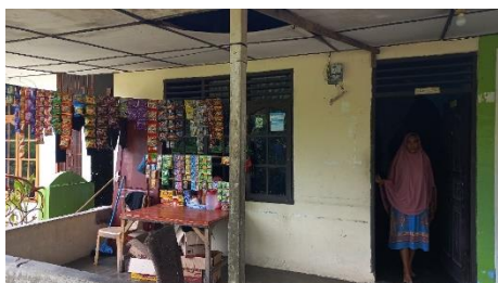
Foto usaha lapak berkah, usaha mikro perseorangan berupa usaha jajanan oleh Ibu Sulastri.