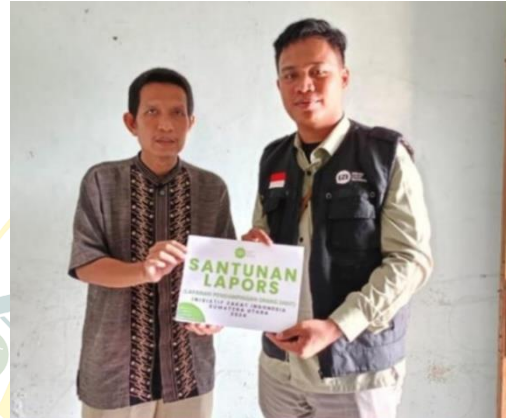
Penyerahan bantuan LAPORS (Layanan Pendampingan Orang Sakit) oleh Tim Pendayagunaan IZI, yang merupakan bantuan untuk kebutuhan kesehatan