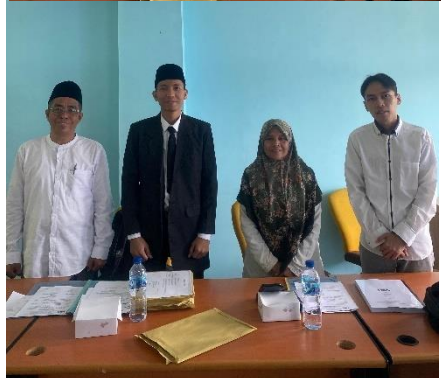
Foto bersama penulis usai melaksanakan Sidang Tesis pada hari Senin, 1 September 2024