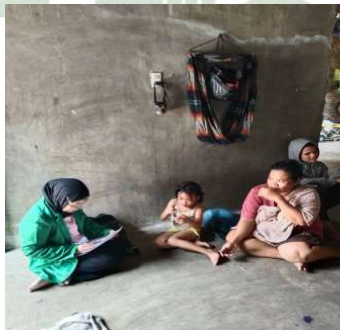
Gambar 2. Pengisian Kuesioner