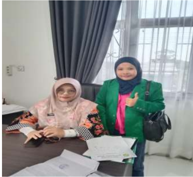
Gambar 1. Foto Bersama Kepala Puskesmas Terjun