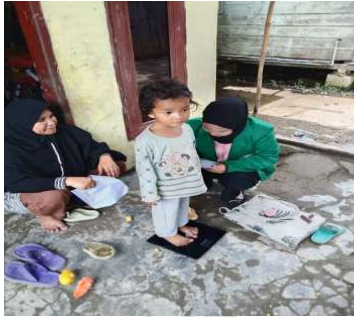
Gambar 3. Penimbangan Berat Badan