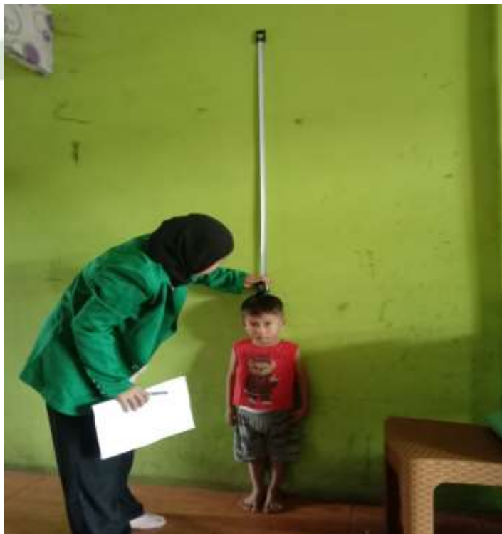
Gambar 4. Pengukuran Tinggi Badan