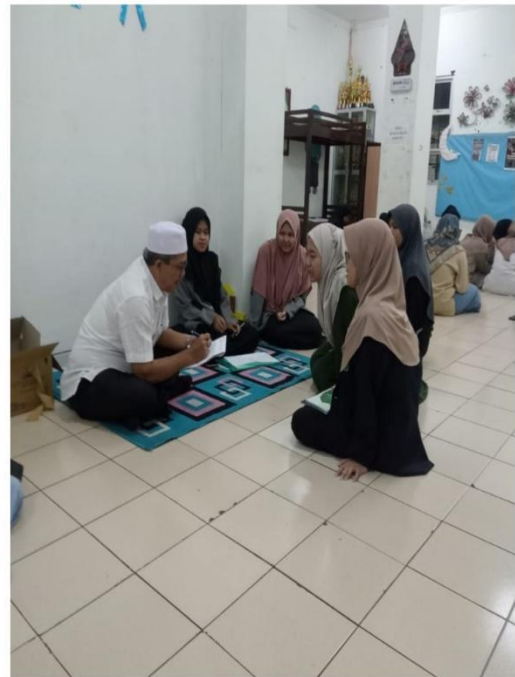
wawancara Di Ma'naa Universitas Maulana Malik Ibrahim Malang