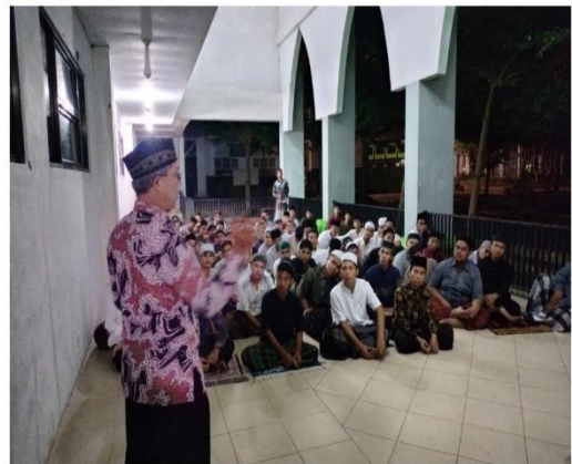
Wawancara Di Ma'had Universitas Islam Negeri Syekh Ali Hasan Ahmad Addary Padangsidempuan