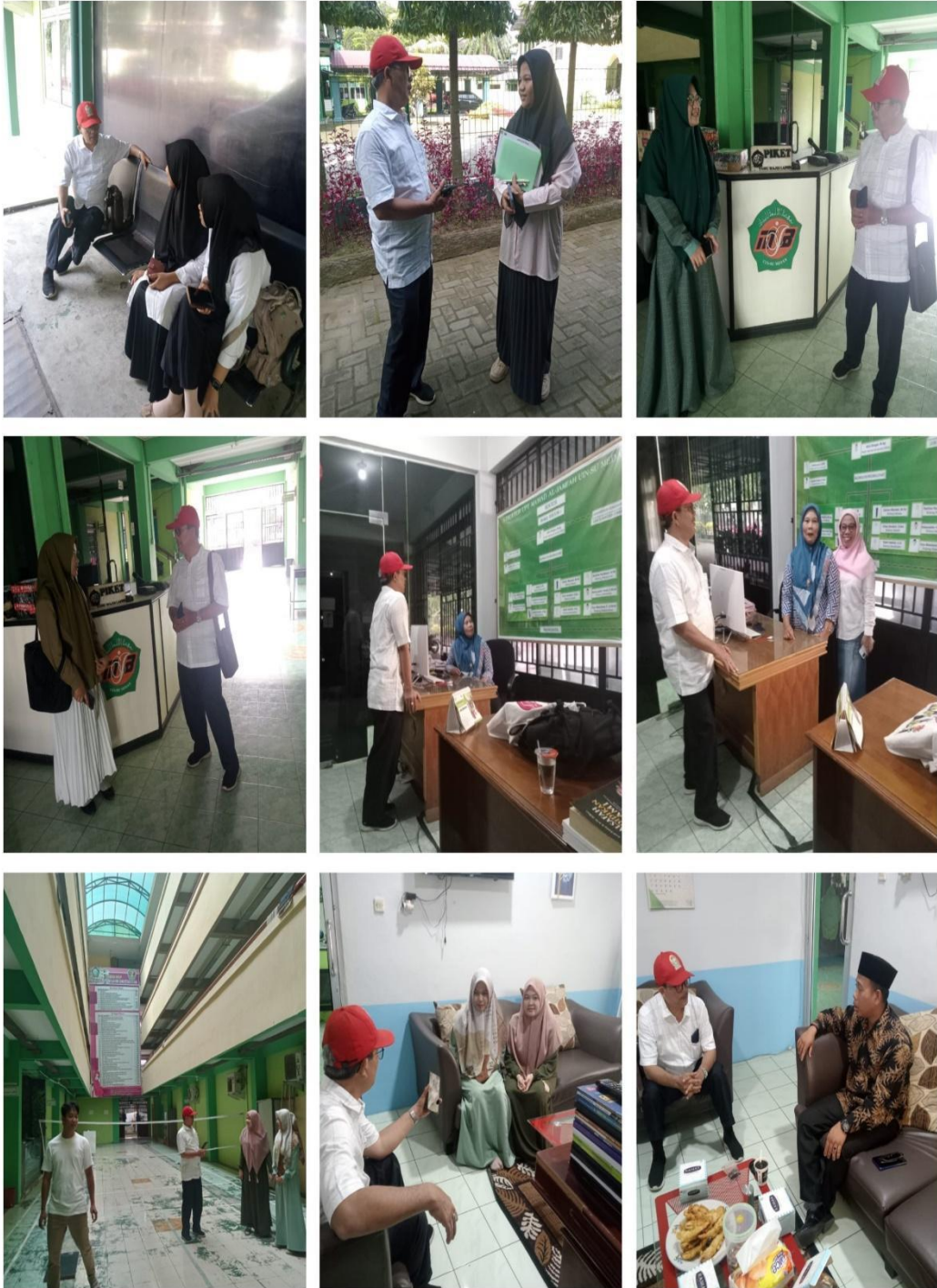
Wawancara Di Ma'had Universitas Islam Negeri Sumatera Utara Medan