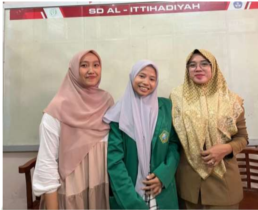
Poto Bersama Kepala Sekolah dan Guru Kelas