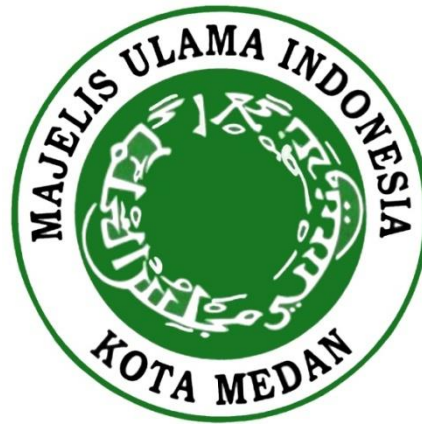
Gambar 4: Logo Majelis Ulama Indonesia Kota Medan