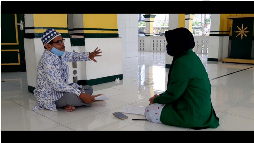
Foto Kunjungan Ke Masjid Agung Rantauprapat dan Wawancara dengan Pengurus BKM Masjid Agung Rantauprapat Sekaligus Pernah Menjabat Sebagai Pengurus Dewan Harian Cabang Angkatan 45 Kabupaten Labuhanbatu Bapak H.