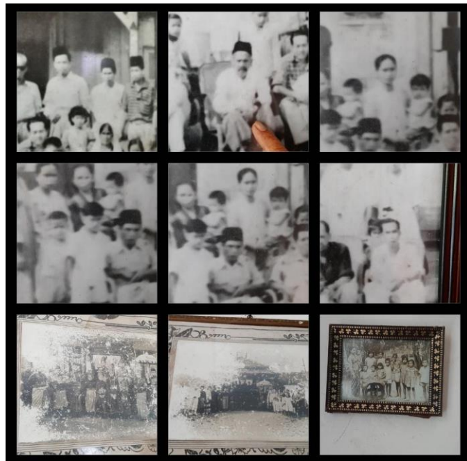
Foto Beberapa Kegiatan dan Perkumpulan Keluarga Kerajaan Rantauprapat.