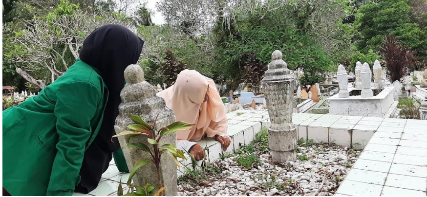
Foto Kunjungan Ke Makam Raja Putra Gelar Mangaraja Setia Lela Muda II.