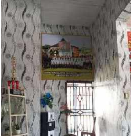
Ruangan P2U Pegawai