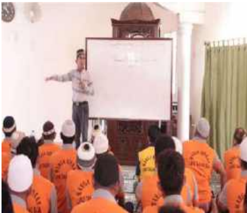
Proses Pembelajaran Pria Persiapan shalat Jum'at berjamaah