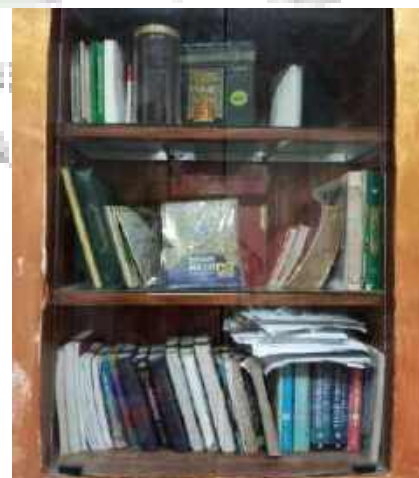
Rak Buku Ajar