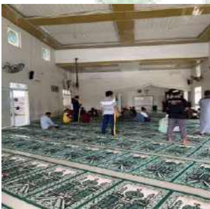
Shalat Sunnah Dhuha