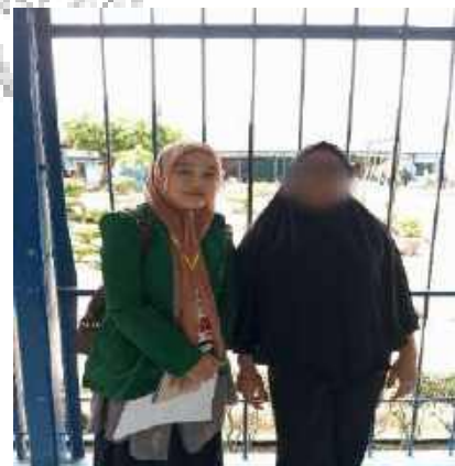
Narapidana Wanita: Ibu Paet