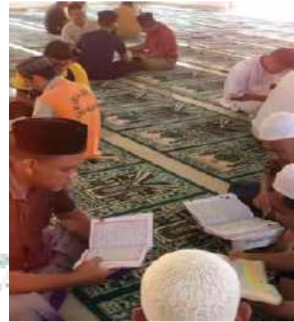
Belajar dan Mengajar Mengaji