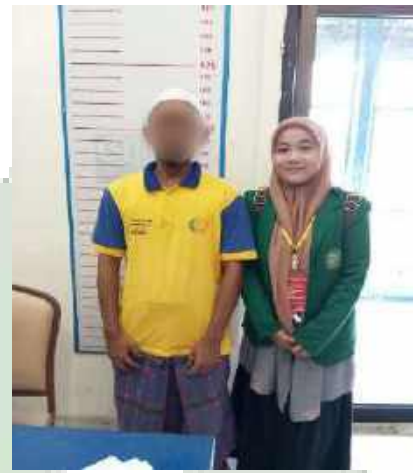
Narapidana Pria: Bapak Dedek