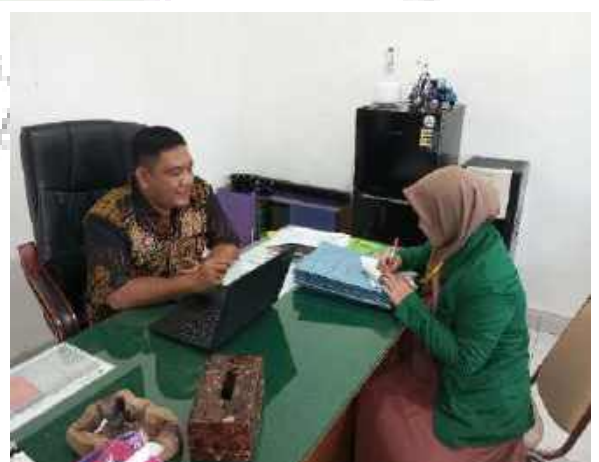
Wawancara Kasi Binadik dan Giatja