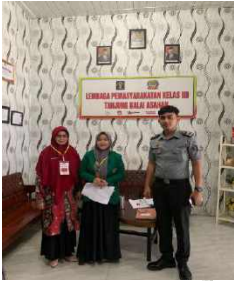
Foto bersama Informan