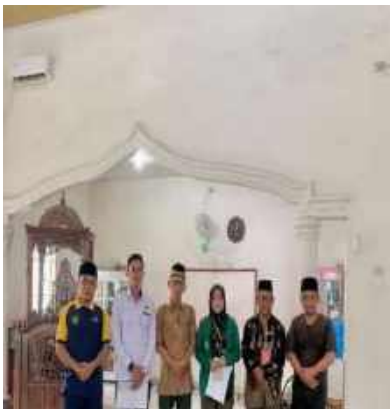
Foto bersama Informan