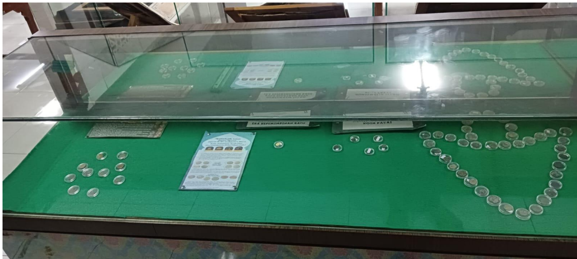
Foto vitrin penyimpanan koin keuh Bandar Aceh Darussalam