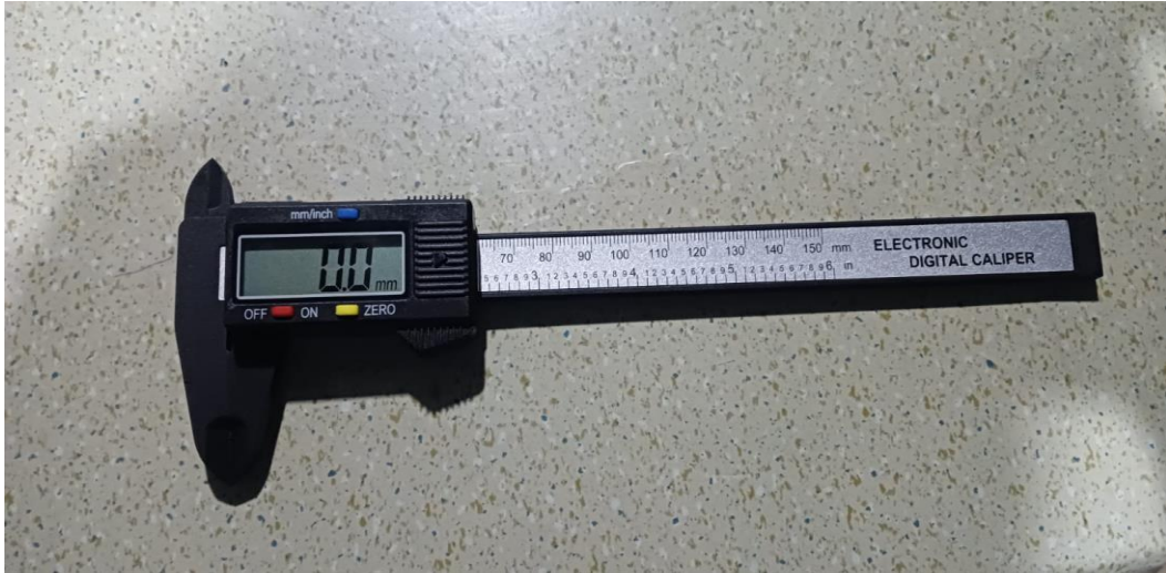
Foto alat pengukur diameter koin