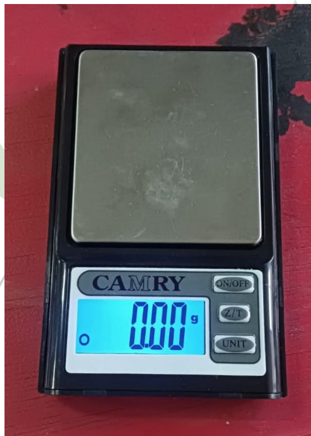
Foto alat ukur berat koin