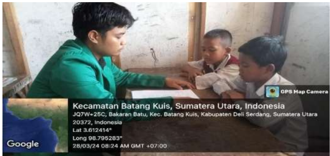
Gambar diatas adalah ketika peneliti melakukan wawancara dengan beberapa siswatentang literasi dari sudut pandang siswa.