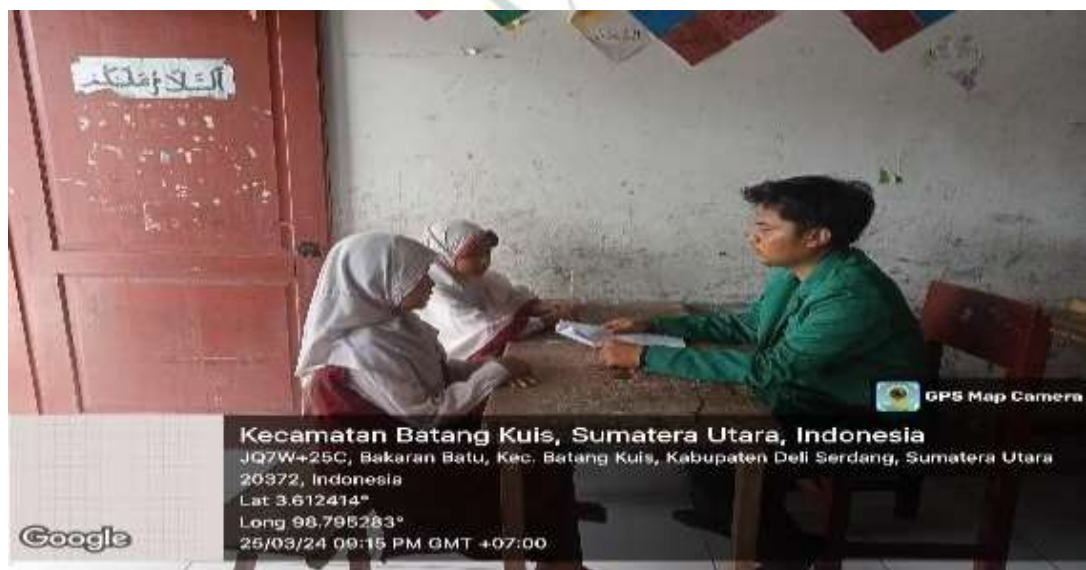
Gambar diatas adalah ketika peneliti melakukan wawancara dengan beberapa siswatentang literasi dari sudut pandang siswa