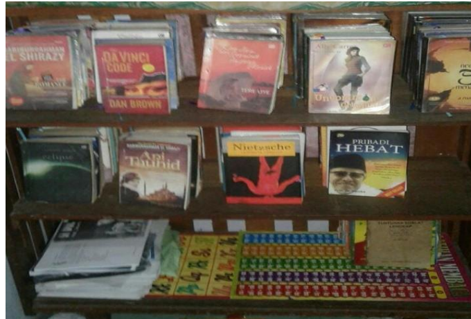
Koleksi buku ditaman baca Masyarakat penjuru langit tanjung pura