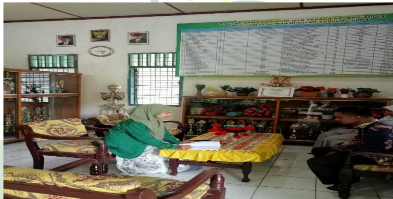
Wawancara dengan informan 2 pada 10 mei 2024