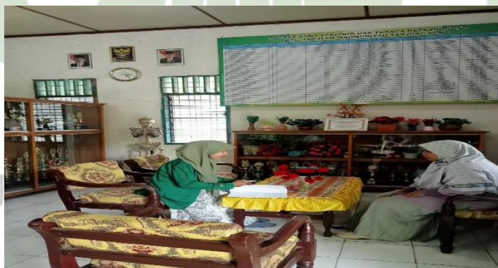
Wawancara dengan informan 3 pada 11 Mei 2024