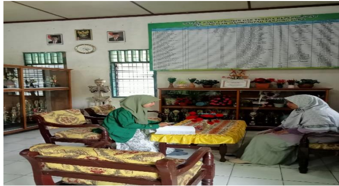
Wawancara dengan Informan 1 pada 09 Mei 2024