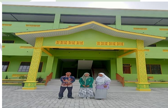
Taman Baca Masyarakat Penjurulungit