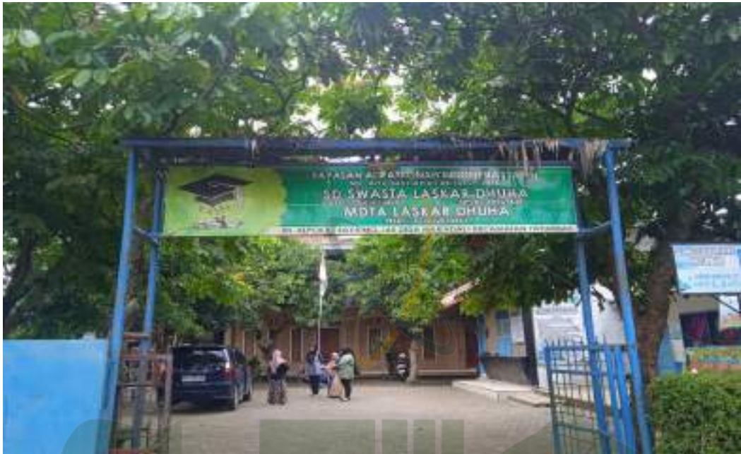
Gedung sekolah SD Swasta Laskar Dhuha tampak depan