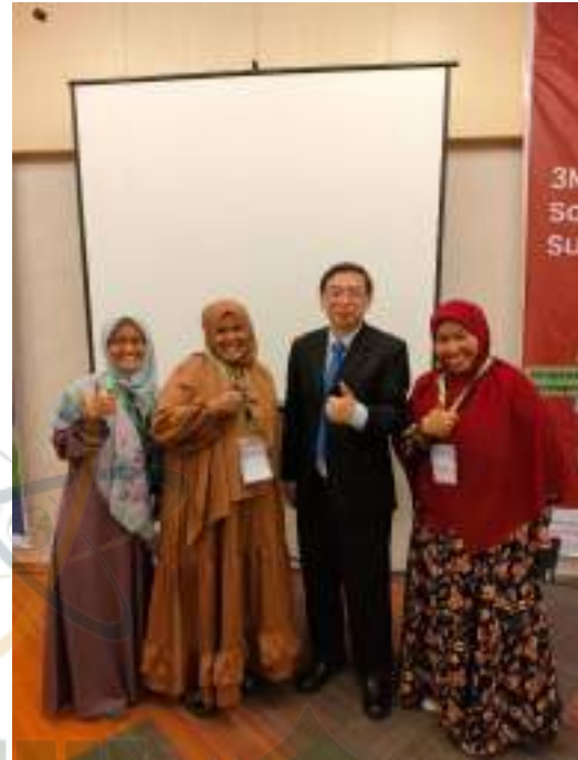
Foto peningkatan dan penguatan kompetensi manajerial kepala sekolah sebagai kepala sekolah penggerak di berbagai kegiatan