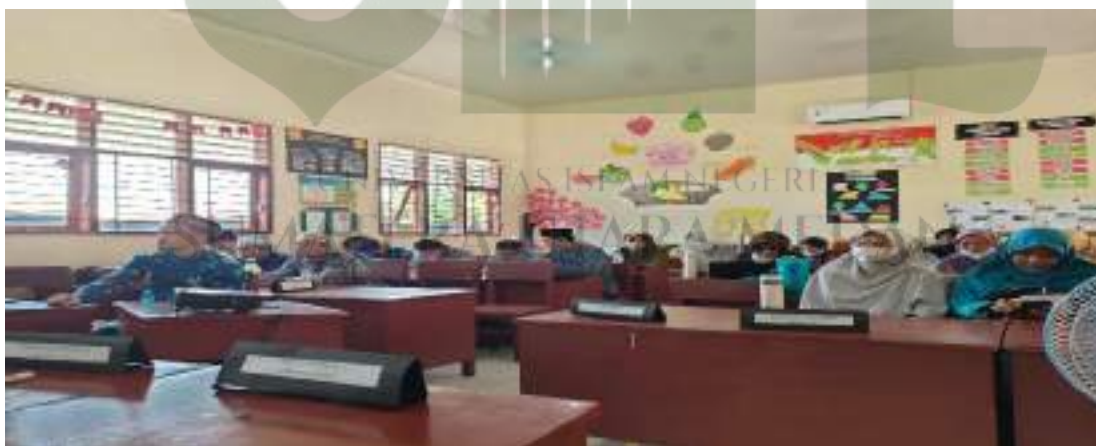
Foto kegiatan in house training di lingkungan sekolah merupakan strategi kepala sekolah dalam penguatan SDM pendidik