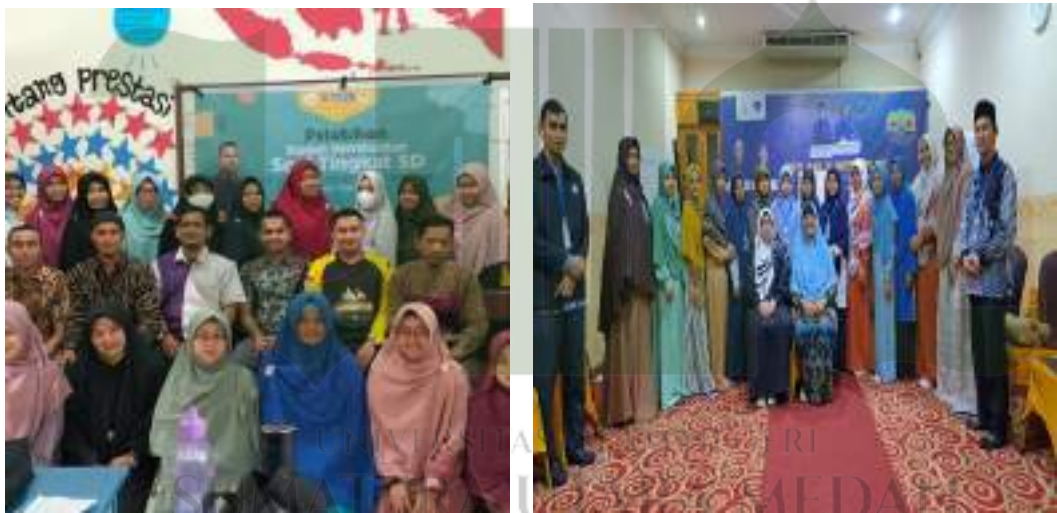
Foto peningkatan dan penguatan kompetensi pendidik di berbagai kegiatan dalam rangka peningkatan SDM