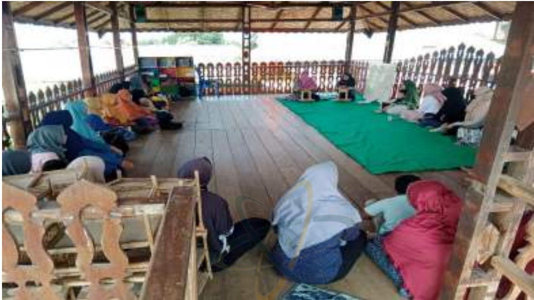
Foto sosialisasi kegiatan pembelajaran kepada orang tua peserta didik termasuk sosialisasi visi, misi dan tujuan pendidikan sebagai sekolah penggerak. Menguatkan peran orang tua sebagai mitra satuan Pendidikan ( karakteristik utama kurikulum merdeka)