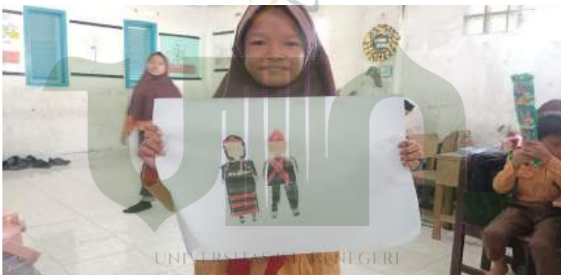
Foto kegiatan belajar pengembangan karakter berkebhinekaan global dan kreatif sebagai bagian dari penguatan profil pelajar Pancasila. Implementasi kurikulum Merdeka.