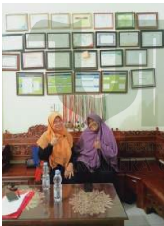
Foto setelah wawancara dengan kepala sekolah dan para guru di SD IT Al Hijrah 2 ( waktu yang berbeda)