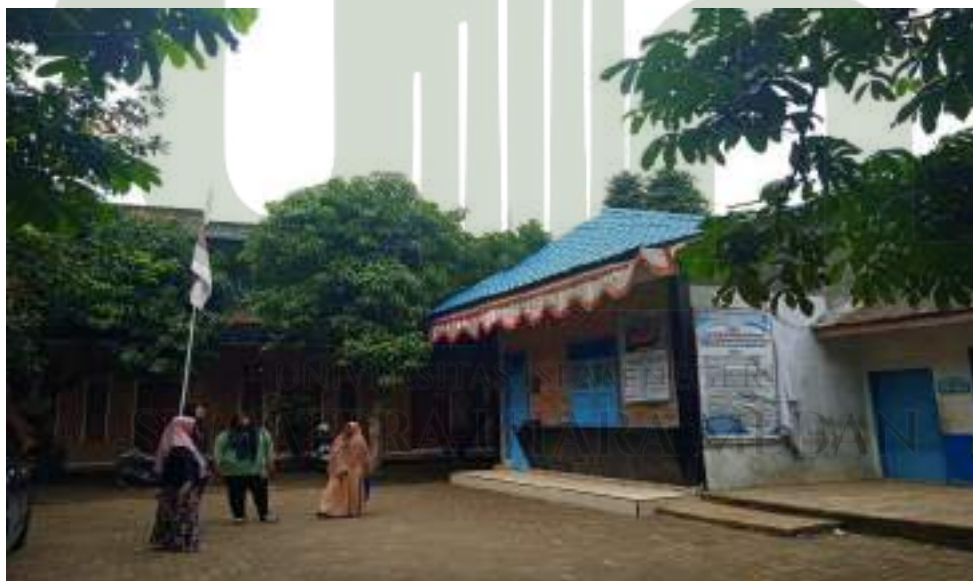
Foto visi misi dan tujuan sekolah SD Swasta Laskar Dhuha