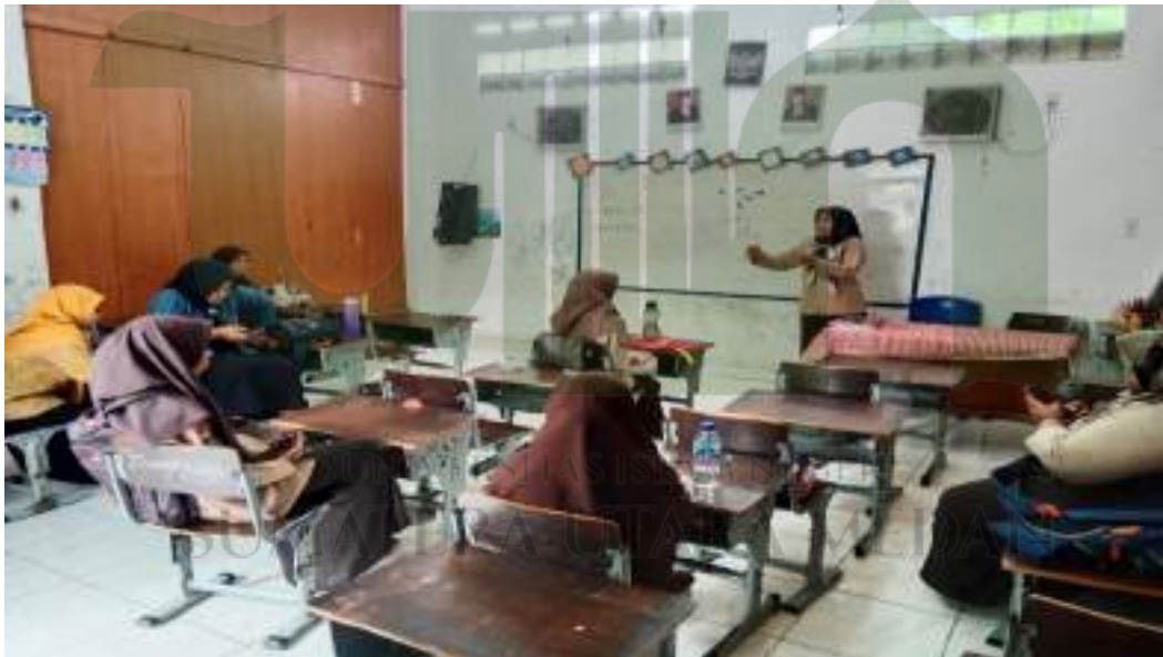
Foto kegiatan pengimbasan ke berbagai sekolah di beberapa kecamatan di kabupaten Deli Serdang yang dilakukan oleh tim guru dan kepala sekolah SD Swasta Laskar Dhuha dalam rangka praktik baik pada program sekolah penggerak, sekaligus belajar melalui platform Merdeka belajar