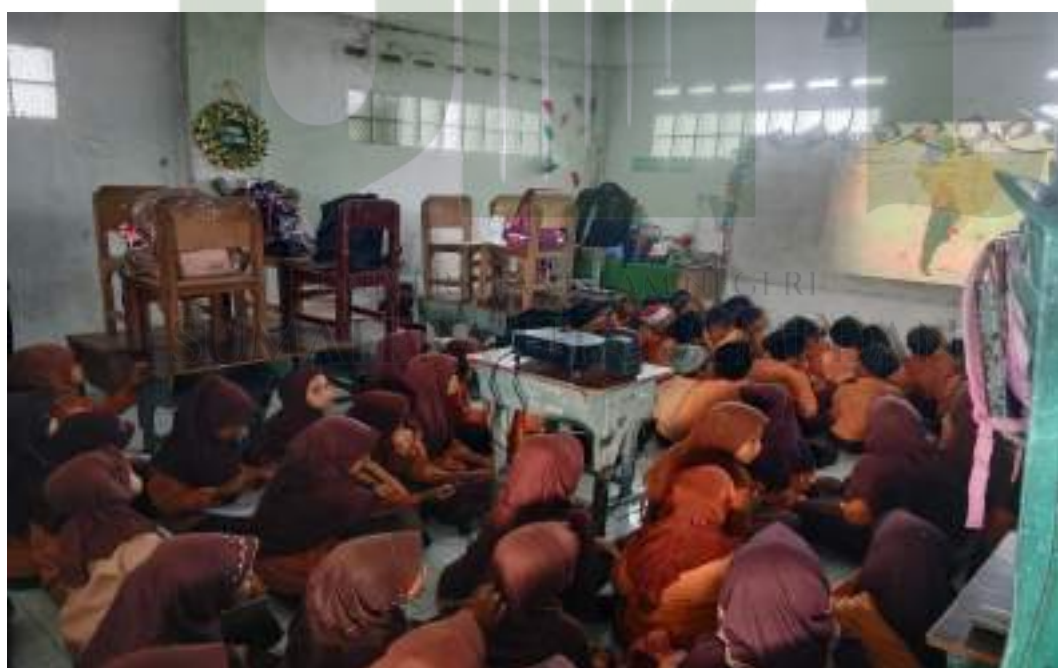
Foto kegiatan proses pembelajaran dengan pemanfaatan teknologi, salah satu strategi guru dalam penyampaian materi ajar