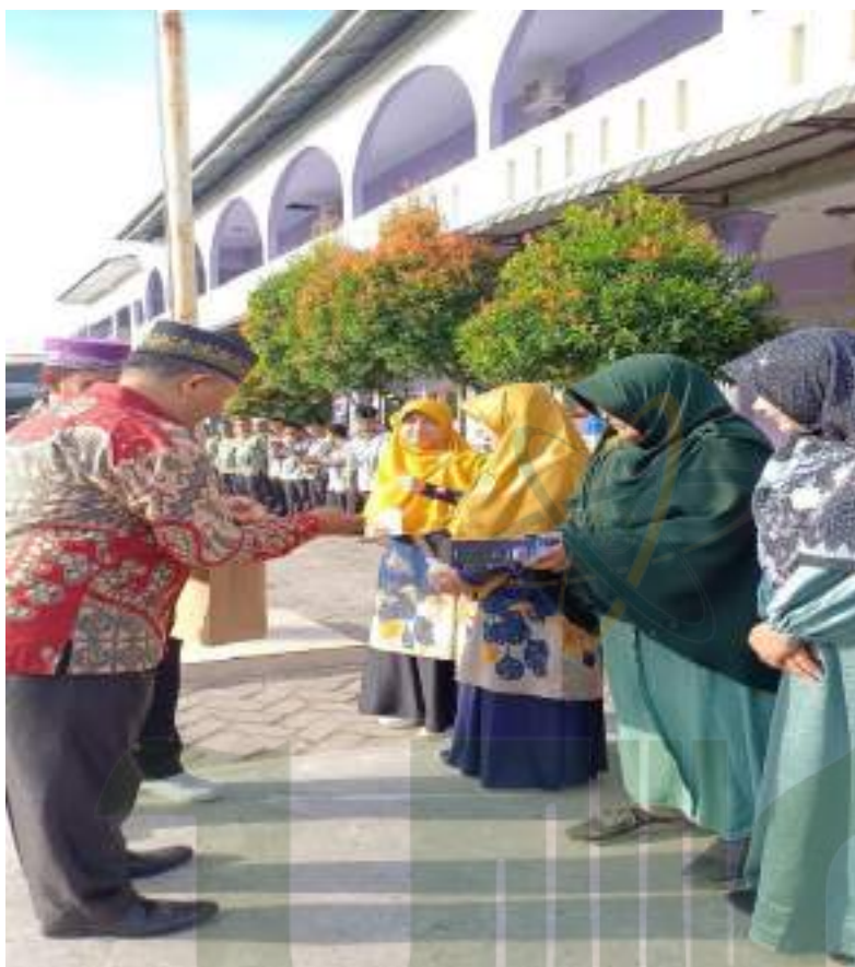
Foto kegiatan pemberian reward dari yayasan kepada kepala sekolah dan guru yang memiliki kinerja baik sebagai motivasi kerja