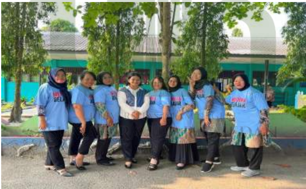
Foto mengikuti kegiatan workshop di berbagai kegiatan, khusus sekolah penggerak. Sebagai bagian strategi kepala sekolah untuk meningkatkan SDM guru, supaya ilmu yang diperoleh dapat diimplementasikan di satuan pendidikan sehingga mutu pendidikan akan lebih cepat tercapai.