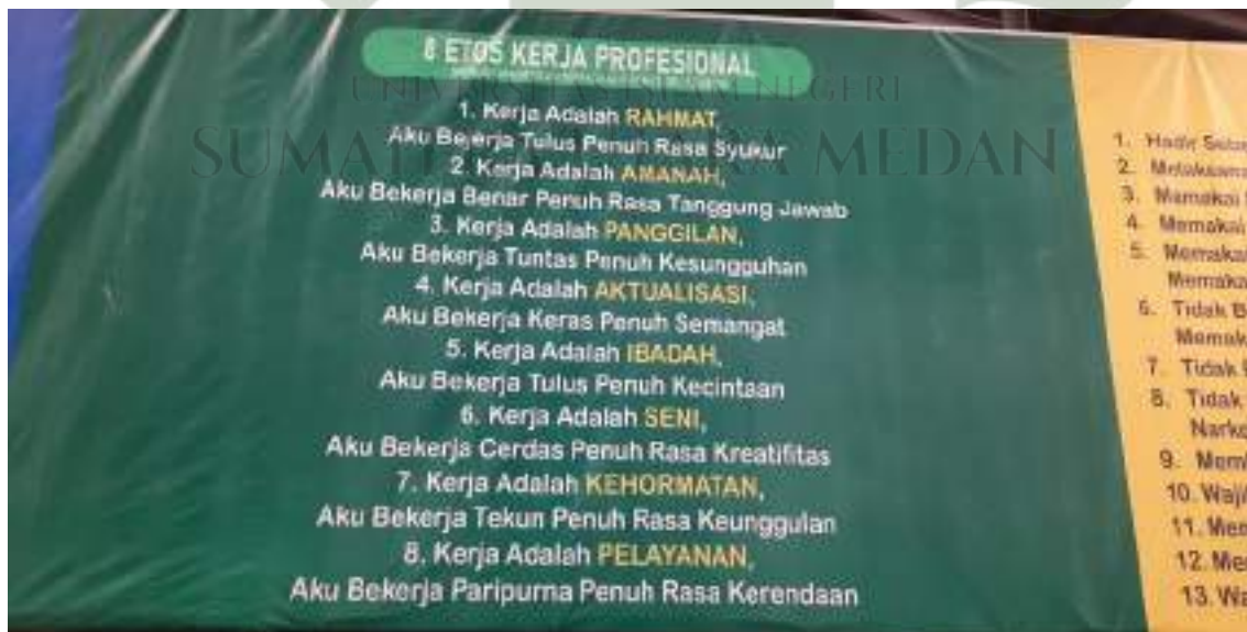
Foto Etos kerja profesional yang sasarannya adalah para pendidik dan tenaga kependidikan, merupakan bagian strategi kepala sekolah dalam proses menuju peningkatan mutu pendidikan melalui motivasi berkelanjutan.