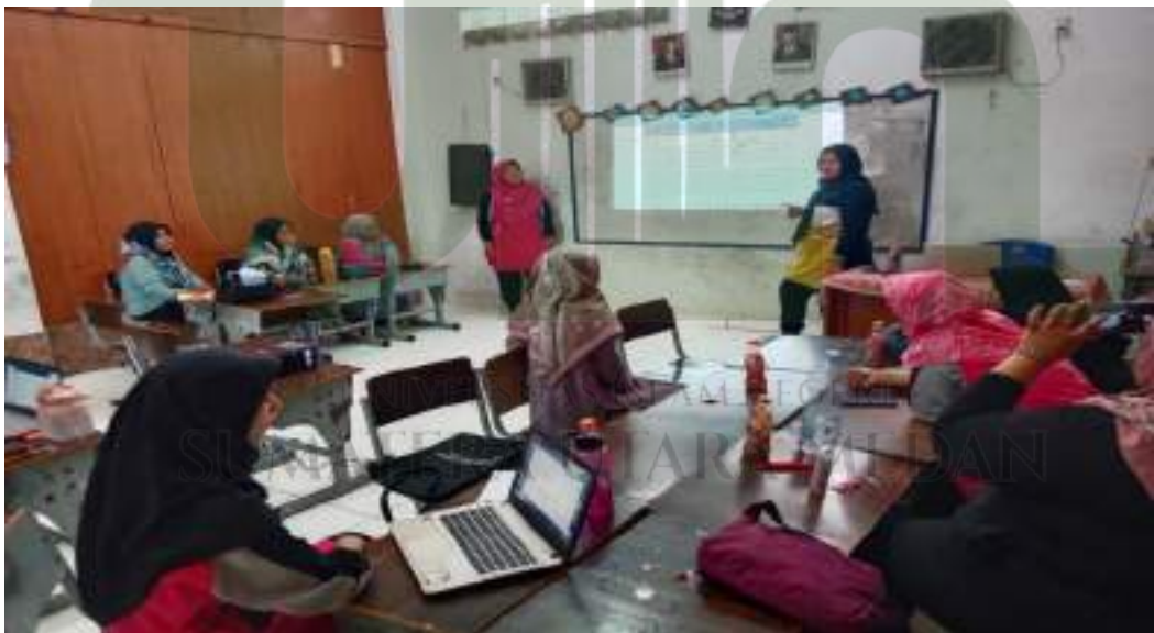
Foto kegiatan in house training Kepala sekolah membuat pelatihan internal dengan sasaran para pendidik di SD Swasta Laskar Dhuha