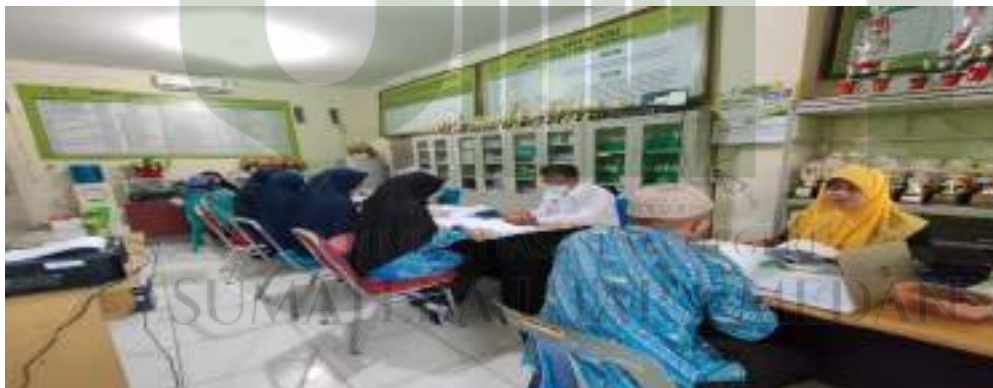
Foto kegiatan rapat rutin internal guru yang sudah terjadwal dalam rangka konsolidasi, monitoring dan evaluasi program kegiatan , merupakan bagian dari strategi kepala sekolah