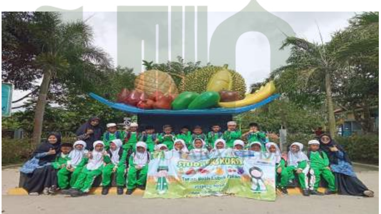
Foto kegiatan ekstrakurikuler outing class dalam rangka penguatan literasi siswa sebagai tujuan dari implementasi kurikulum Merdeka.