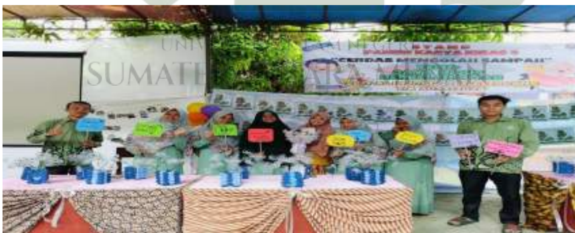
Foto kegiatan implementasi kurikulum merdeka sesuai dengan tema pada penguatan proyek penguatan profil pelajar Pancasila.