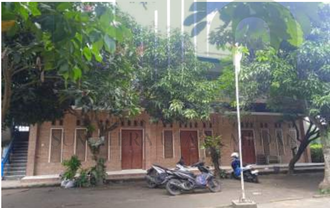
Foto sarana dan prasarana (kantor dan gedung belajar) SDS Laskar Dhuha