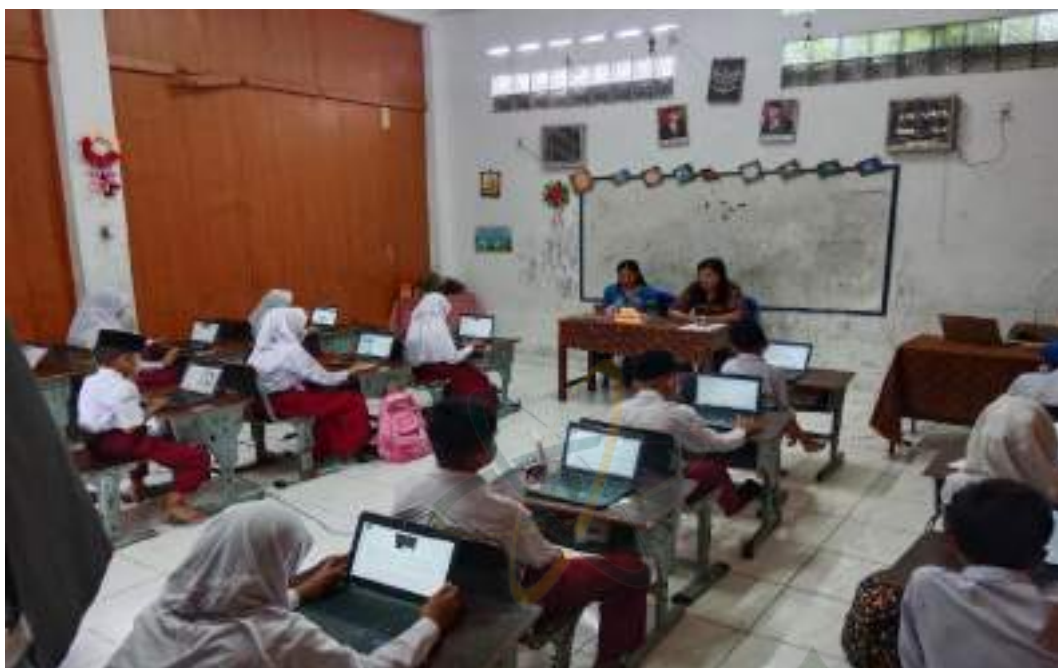
Foto kegiatan assesmen nasional untuk menilai kemampuan bernalar kritis para peserta didik sebagai implementasi dari program sekolah penggerak.