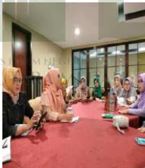
Foto kegiatan rapat rutin kepala sekolah se kecamatan Percut Sei Tuan wilayah 5 dalam rangka koordinasi dengan dinas pendidikan