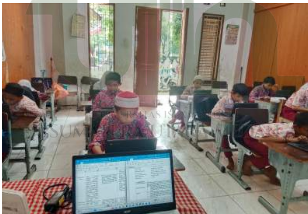
Foto kegiatan pembelajaran literasi dan numerasi secara digital sebagai implementasi dari program sekolah penggerak.