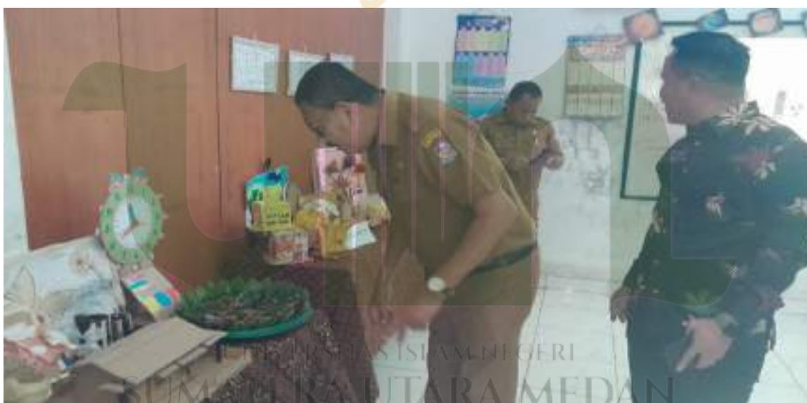
Foto panen karya dalam project penguatan profil pelajar pancasila. Tampak kordinator wilayah kecamatan bersama ketua yayasan berkeliling melihat hasil karya anak. Salah satu P5 yang sudah diimplementasikan di SD Swasta Laskar Dhuha sebagai salah satu sekolah penggerak.