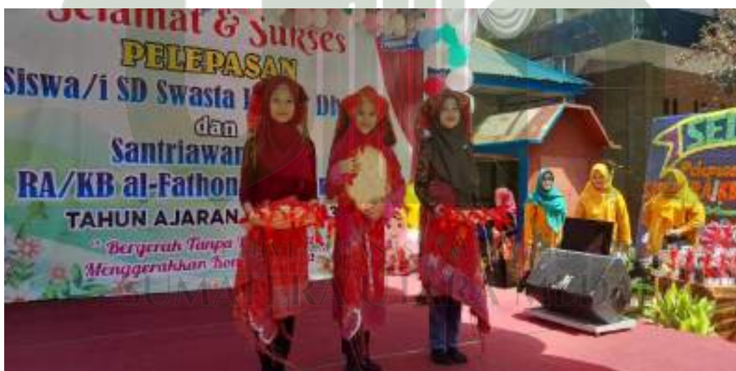
Foto kegiatan literasi numerasi dan menari , proses belajar dalam pengembangan karakter berkebhinekaan global, mandiri dan berakhlak mulia sebagai bagian dari penguatan profil pelajar Pancasila. Implementasi kurikulum Merdeka