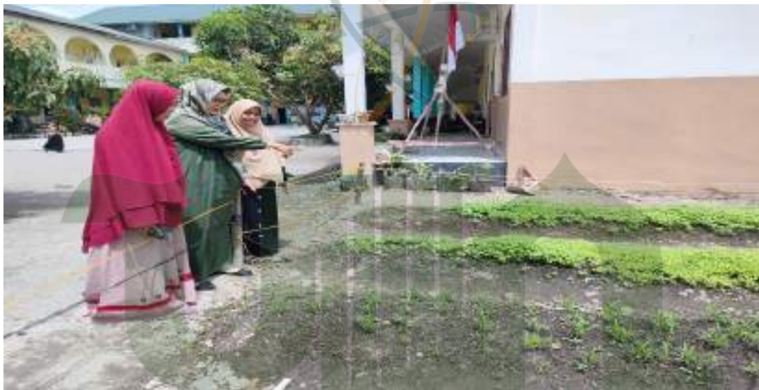
Foto hasil karya anak pada kegiatan panen karya sebagai implementasi kurikulum merdeka pada kegiatan proyek penguatan profil pelajar pancasila yang dibuka oleh pengawas sekolah penggerak kecamatan Percut Sei Tuan kabupaten Deli Serdang