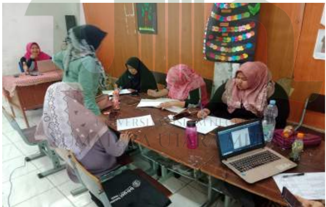
Foto kegiatan pengimbasan ke berbagai sekolah di beberapa kecamatan di kabupaten Deli Serdang yang dilakukan oleh tim guru dan kepala sekolah SD Swasta Laskar Dhuha dalam rangka praktik baik pada program sekolah penggerak