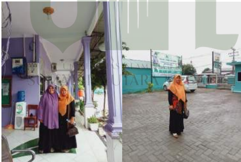
Foto bersama kepala sekolah di lingkungan sekolah