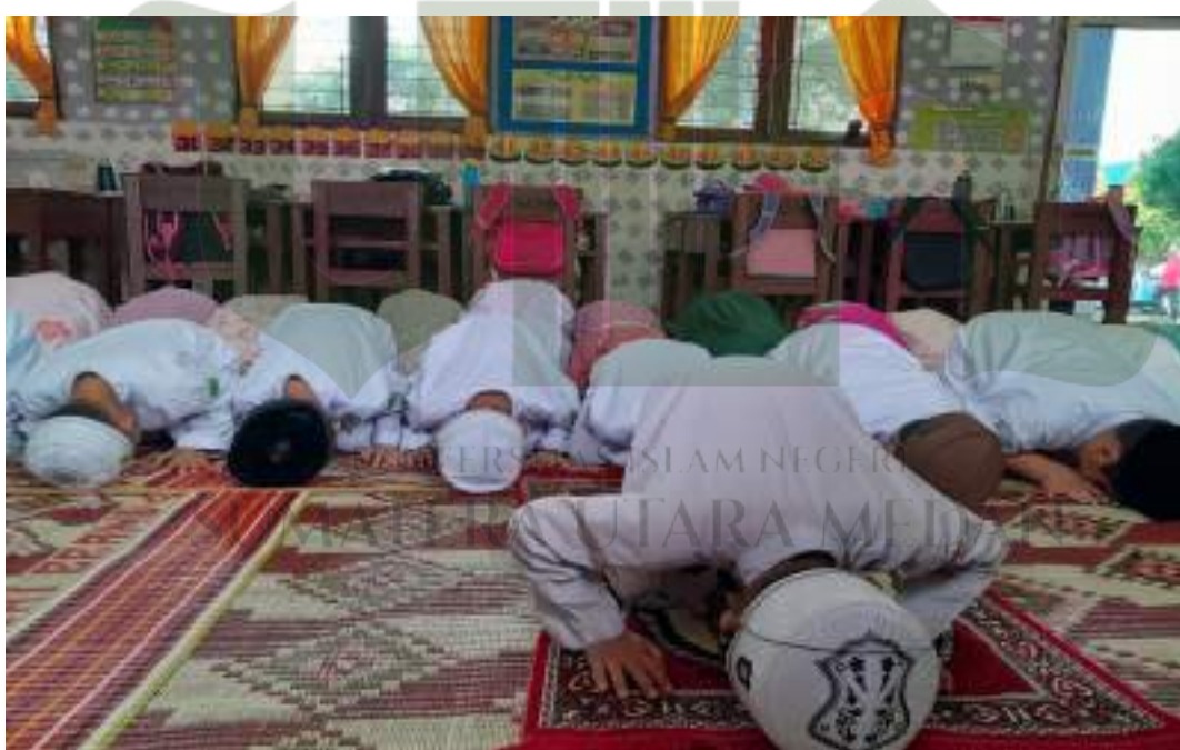
Foto kegiatan siswa dalam penguatan karakter palajar pancasila yaitu beriman dan bertakwa kepada Tuhan Yang Maha Esa