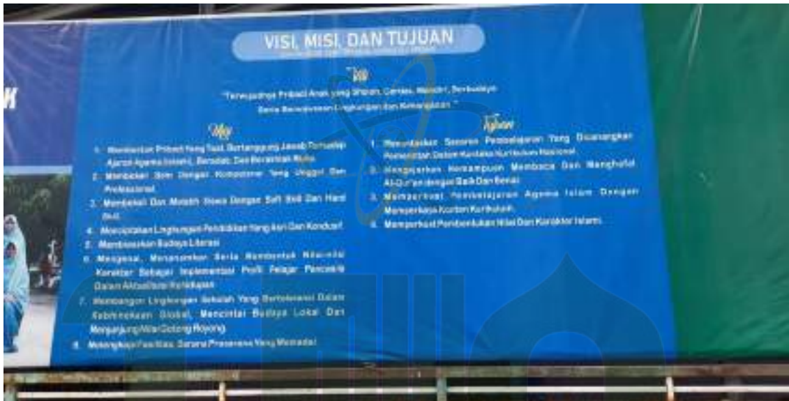
Foto visi, misi dan tujuan sekolah dasar Islam terpadu Al Hijrah 2