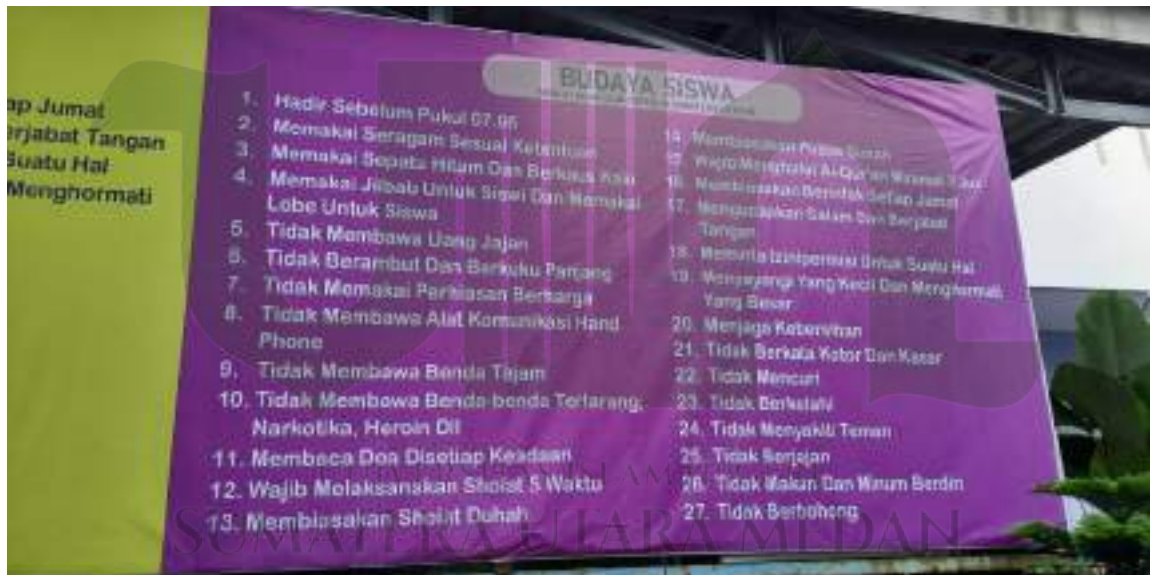
Foto budaya guru dan budaya siswa yang ditempatkan di lingkungan sekolah supaya mudah terbaca oleh warga satuan Pendidikan. merupakan bagian dari strategi kepala sekolah dalam pembiasaan yang harus selalu diingatkan.