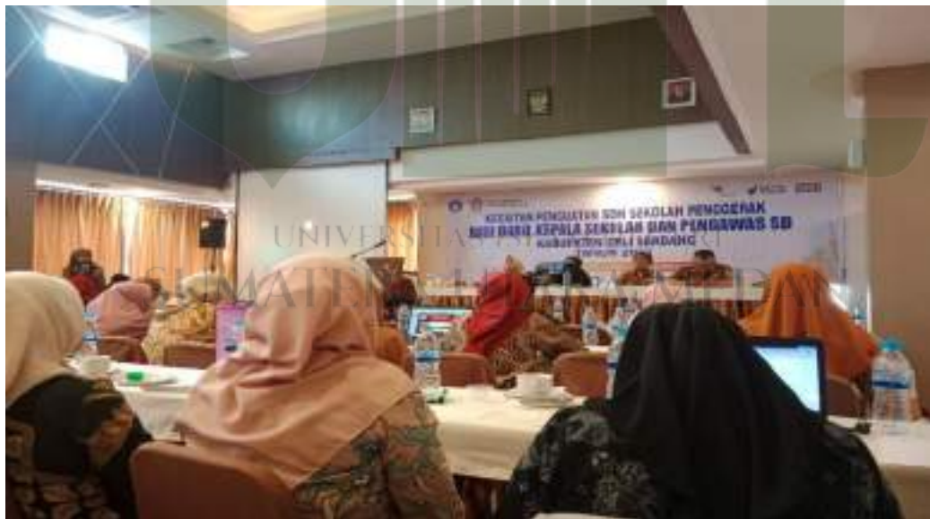
Foto penguatan SDM sekolah penggerak bagi guru dan kepala sekolah Strategi kepala sekolah sebagai bagian dari strategi peningkatan mutu pendidikan