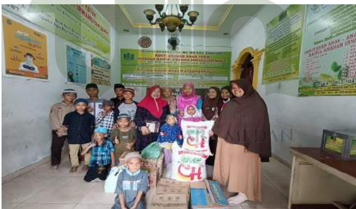
Foto kegiatan amal oleh siswa SD IT AL Hijrah ke panti asuhan sebagai implementasi karakter profil pelajar pancasila