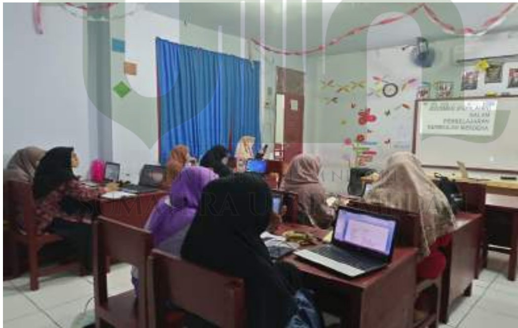
Foto kegiatan membentuk komunitas belajar ke berbagai sekolah di beberapa kecamatan di kabupaten Deli Serdang yang dilakukan oleh tim guru dan kepala sekolah SD Swasta Laskar Dhuha dalam rangka praktik baik pada program sekolah penggerak