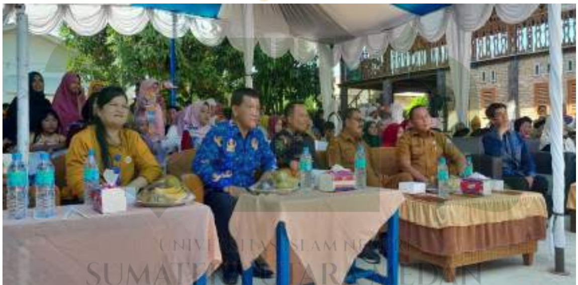
Foto kegiatan program sekolah penggerak di SD Swasta Laskar Dhuha, melibatkan unsur pemerintah yaitu kepala desa, unsur dinas pendidikan yaitu kordinator wilayah kecamatan dan pengawas penggerak, yayasan, tokoh masyarakat, orang tua dan semua tim pendidik dan tenaga kependidikan sebagai salah satu strategi kepala sekolah dalam meningkatkan mutu pendidikan