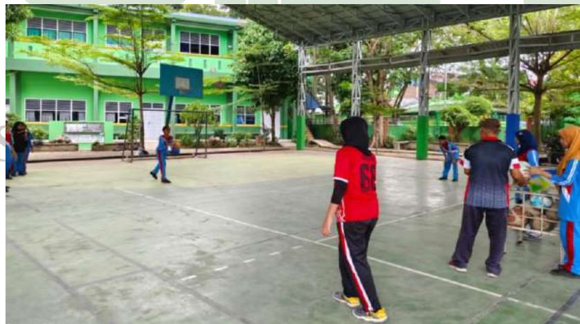
KEGIATAN EKSTRAKULIKULER BOLA FUTSAL