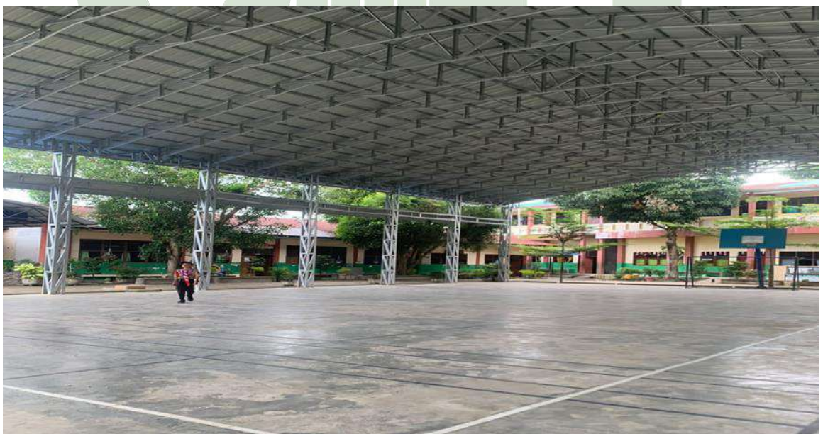
LAPANGAN MTS N 2 DELI SERDANG