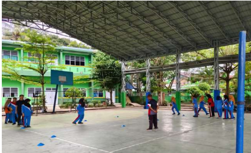
PEMANASAN SEBELUM LATIHAN