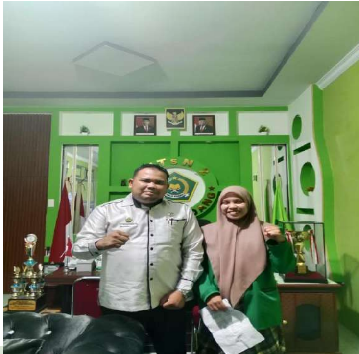
FOTO BERSAMA KEPALA MADRASAH MTS N 2 DELI SERDANG