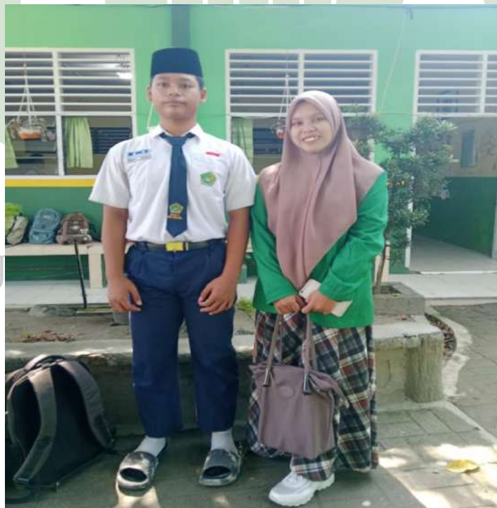
FOTO BERSAMA SISWA MTs N 2 DELI SERDANG