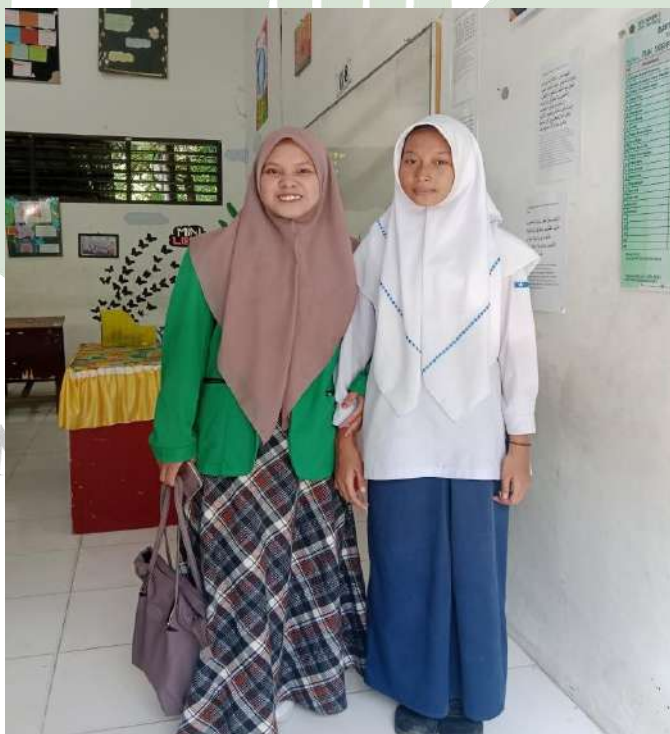
FOTO BERSAMA SISWI MTs N 2 DELI SERDANG