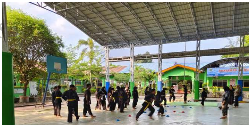
KEGIATAN EKSTRAKURIKULER PENCAK SILAT