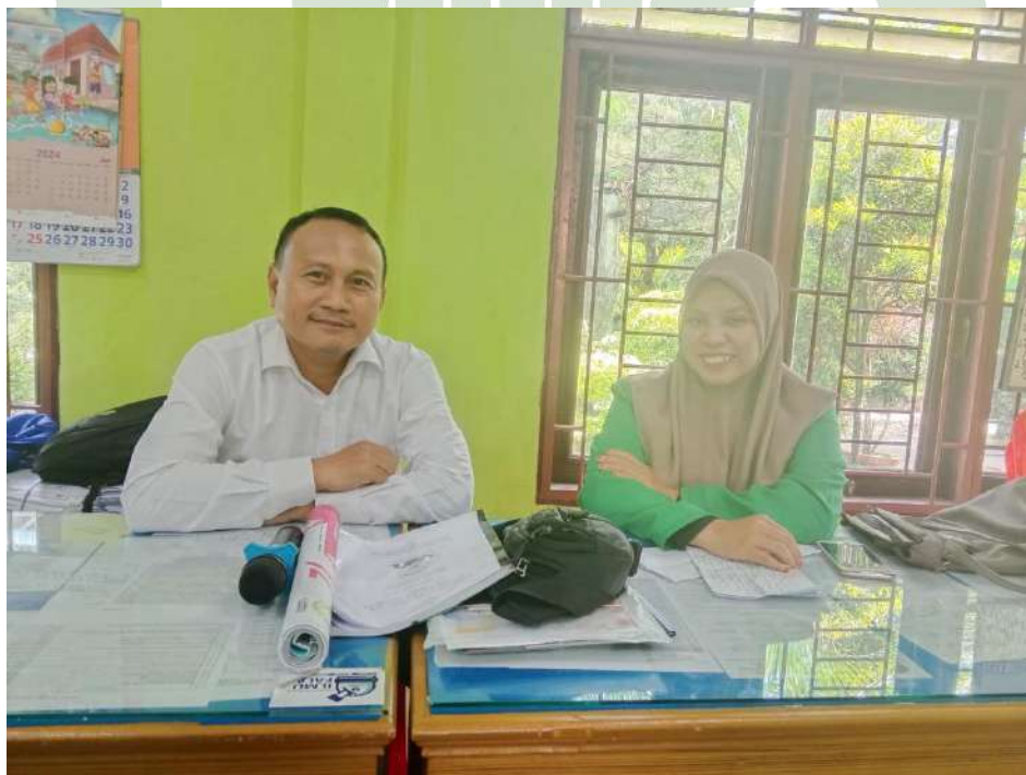
FOTO BERSAMA WAKIL KURIKULUM MADRASAH MTsN 2 DELI SERDANG