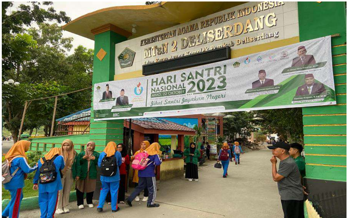
KEGIATAN APEL PAGI MENYAMBUT SISWA DI GERBANG SEKOLAH