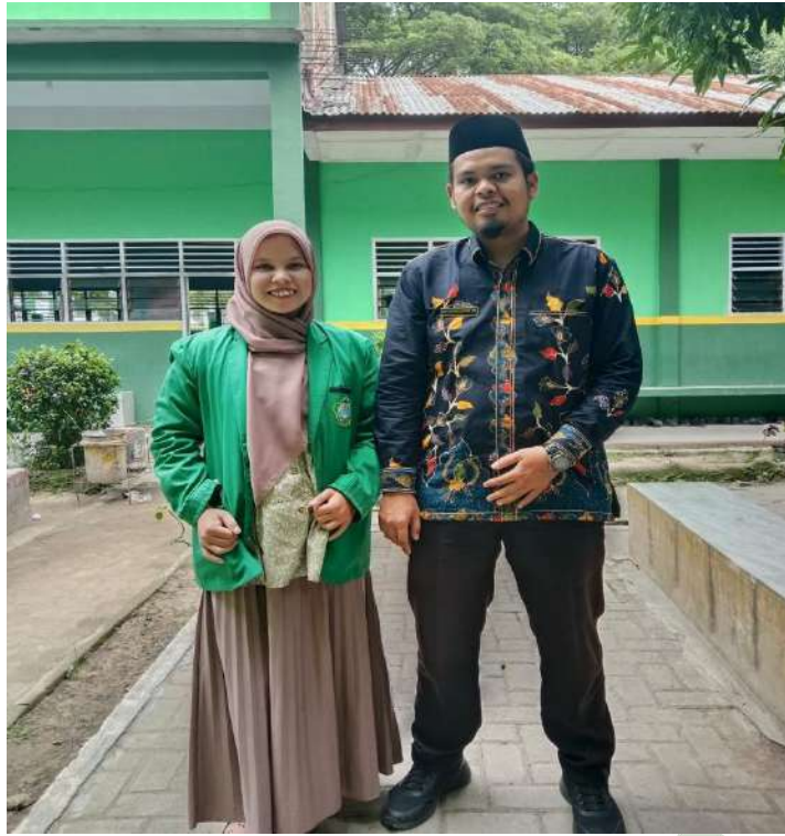
FOTO BERSAMA BIDANG KESISWAAN & PEMBINA EKSTRAKULIKULER