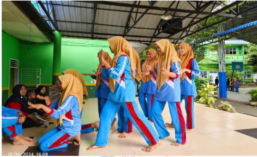
KEGIATAN EKSTRAKULIKULER TARI