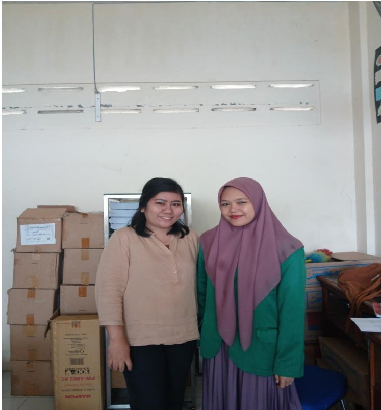
Gambar 3.1 Foto bersama dengan Guru sekaligus Pustakawan Perpustakaan SMK Gelora Jaya Nusantara

UNIVERSITAS ISLAM NEGERI SUMATERA UTARA MEDAN