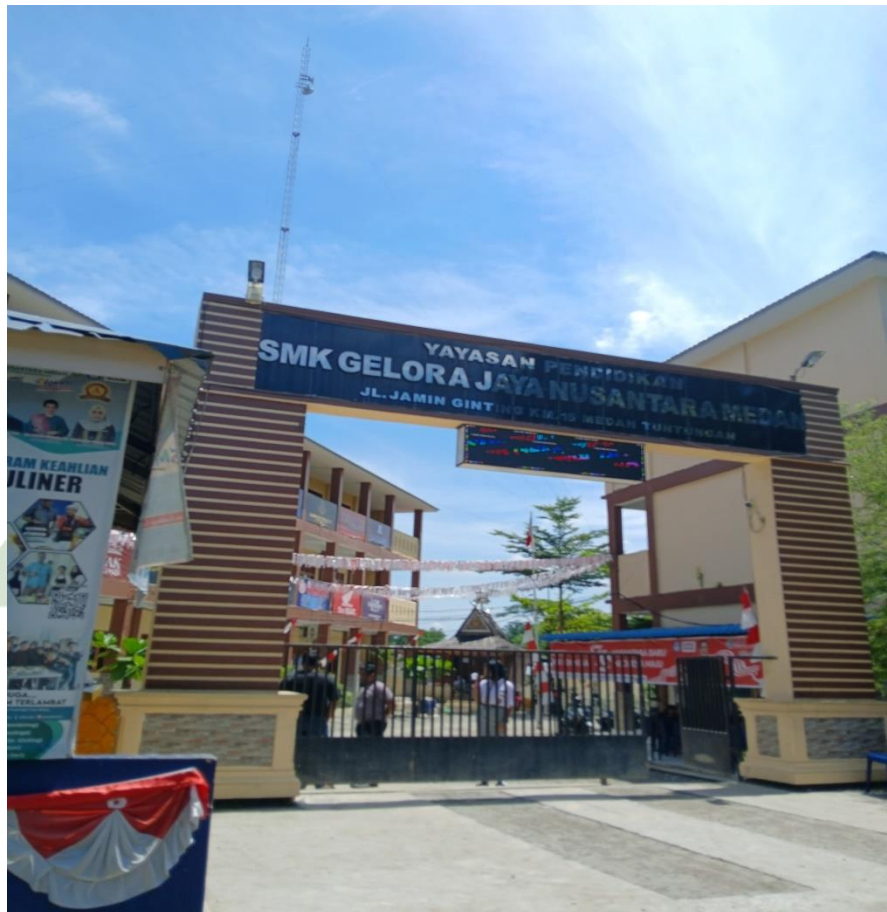
UNIVERSITAS ISLAM NEGERI Gambar 1.1 SUMATERA UTARA MEDAN Depan SMK Gelora Jaya Nusantara