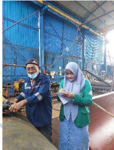
Keterangan 2. Penyebaran Kuesioner