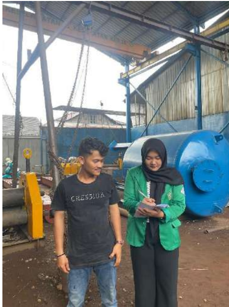
Keterangan 5. Penyebaran Kuesioner