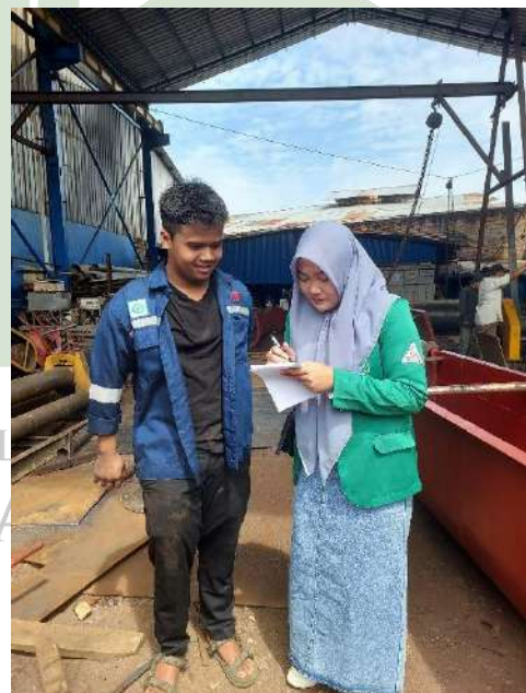
Keterangan 4. Penyebaran Kuesioner