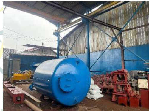
Keterangan 11. Produk yang Dibuat