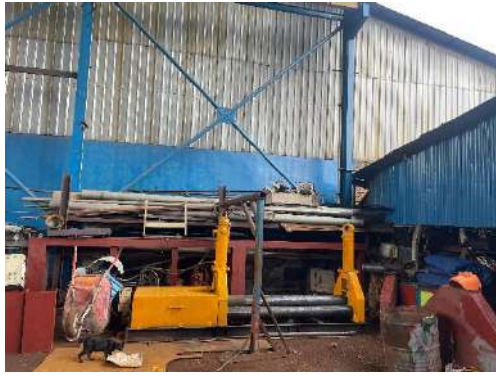
Keterangan 8. Kondisi Tempat Kerja