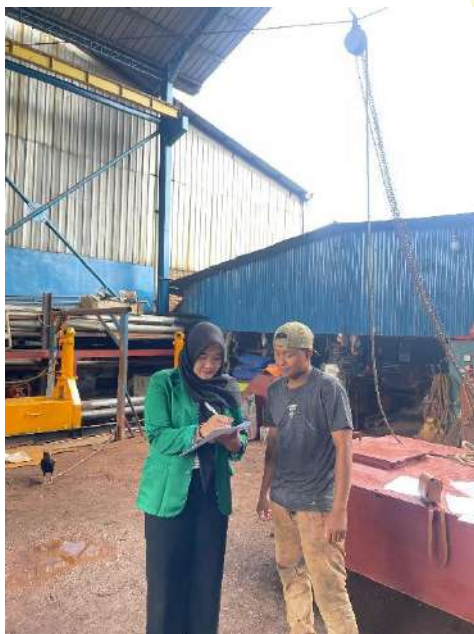
Keterangan 7. Penyebaran Kuesioner