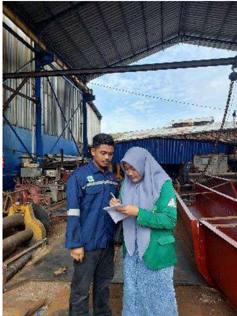
Keterangan 1. Penyebaran Kuesioner