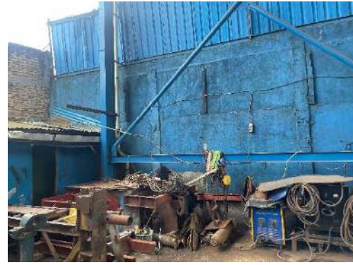
Keterangan 9. Kondisi Tempat Kerja