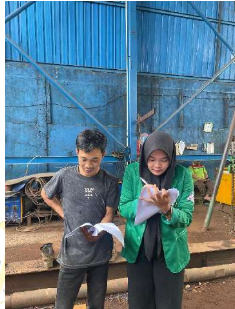
Keterangan 6. Penyebaran Kuesioner