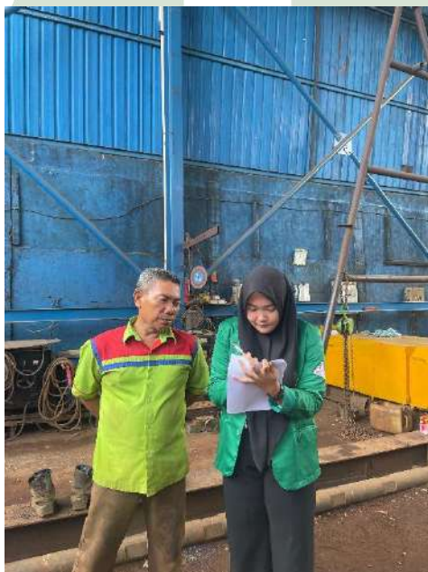
Keterangan 3. Penyebaran Kuesioner