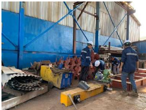
Keterangan 10. Kondisi Tempat Kerja